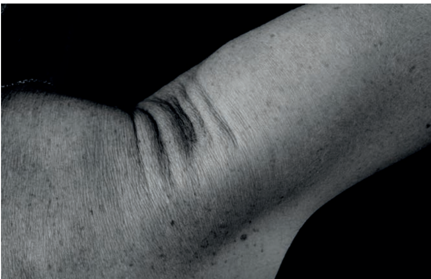
>> Braç, col·lecció privada, 2020.

cions d'imatges, sovint subtilíssimes, amb poc o gens de Photoshop, que no deixa de ser una eina sofisticada, encara que no invalidant, de la fotografia, de l'art. Perquè Eugeni Prieto defuig tant com pot del programari, tot i que admet que adesiara l'usa per dominar certs grisos rebels o massa subtils; en principi, i com exposava John Berger, les fotografies gairebé sempre testimonien una elecció humana en una situació determinada, i «el vertader contingut de la fotografia és invisible, perquè no es deriva d'una relació amb la forma, sinó amb el temps». Hi ha altres aspectes del saber de Berger que probablement l'Eugeni no subscriuria de cap manera, ni jo.