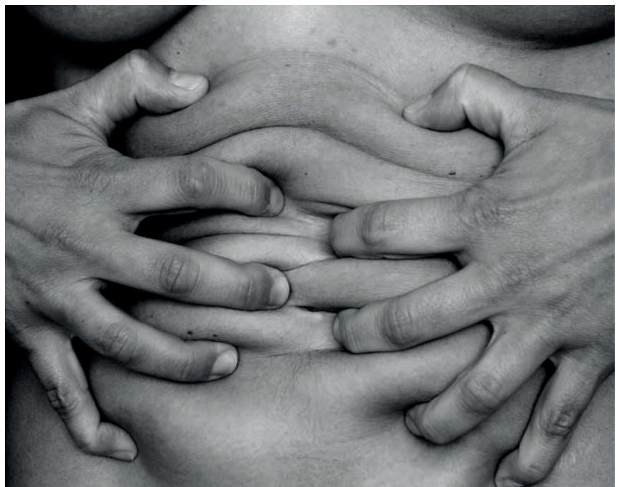
>> Mans i cos, del llibre Reversible, 2016.

plegats moments de nervis i corredisses, i també ens hi va demostrar el seu segell valorant artistes, coneixent-ne o descobrint-ne, perquè la feina desencaixada de la rutina ens excitava i feia sortir el millor de nosaltres mateixos (no sé si ens està bé dir-ho).