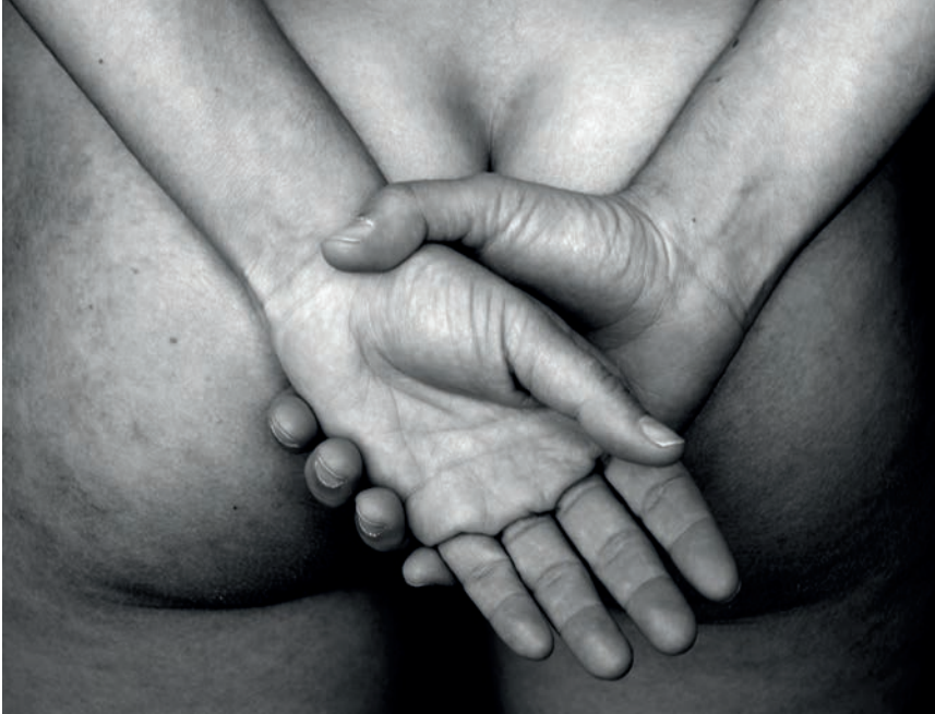
>> Mans, 40 x 50 cm, del llibre Reversible, 2016.