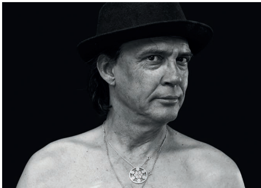
>> L'artista Pep Camp, col·lecció de la Fundació Vila Casas, 2015.