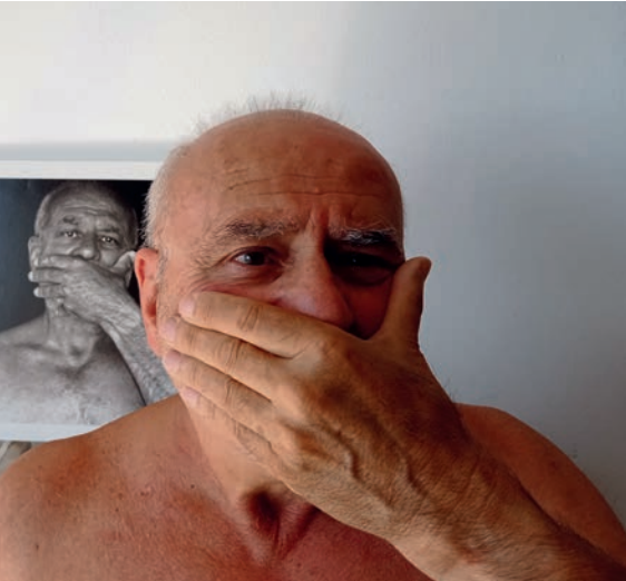
>> Retrat de l'artista.