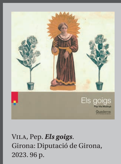
VILA, Pep. Els goigs . Girona: Diputació de Girona, 2023. 96 p.

escrita al frontispici del temple d'Apol·lo a Delfos: «Ne quid nimis», és a dir, 'De res, massa'. Són, en definitiva, uns microrelats sempre suggeridors que mereixen ser llegits amb atenció. Com el més breu de tots, «Col fermentada», que reproduïm sencer en homenatge pòstum al protagonista d'un dels contes tradicionals més coneguts: «Les restes del pobre Patufet aparegueren a Estrasburg, en una llauna de xucrut, acompanyant les salsitxes alsacianes».