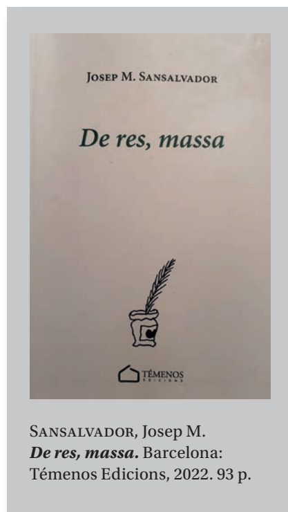
SANSALVADOR, Josep M. De res, massa . Barcelona: Tèmenos Edicions, 2022. 93 p.

I ahir és avui, perquè conèixer el passat és el primer pas per entendre el present.