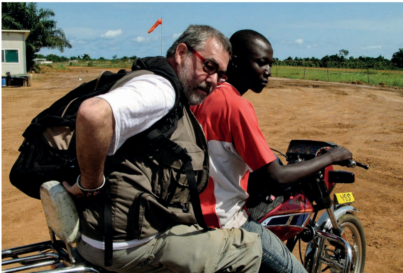
>> A Libèria, el 2008.

fica és una qüestió d'esforç, dedicació i perseverança. Probablement no ha estat un dels millors a dominar la tècnica, però ho ha substituït i compensat amb escreix amb un bon nas i visió periodística, gosadia, ganes de treballar, saber escoltar, conèixer coses i tractar la gent. Unes qualitats que no es produeixen entre els fotògrafs de premsa.