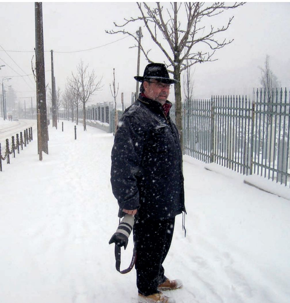
>> A Sarajevo, en plena nevada, el 2006.

ritzons. Amb la càmera a l'esquena, un esperit aventurer i pocs recursos, inicia els seus viatges a Cuba, Nicaragua, Palestina, Israel, Sri Lanka, Libèria i Bòsnia-Herzegovina.