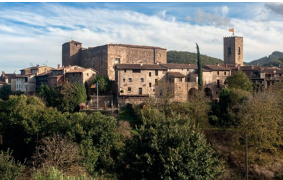
>> Vista de Santa Pau, amb el castell, majestuós, sobresortint al cor de la població.

Cal ajuda per comprar el castell de Santa Pau | L'equip de govern de Santa Pau vol municipalitzar el castell a través d'una compra associativa en què intervingui com més gent millor, ja que no es pot endeutar tot sol amb una compra tan important. Aquest castell emblemàtic i situat al cor de la població no ha sigut mai de propietat municipal. L'edifici ara està molt deteriorat, motiu pel qual el preu de venda ha baixat considerablement, i un dels temors de l'equip de govern és que el pugui comprar un fons especulatiu i el torni a privatitzar. Si el desig municipal s'aconsegueix, la idea seria convertir-ne una part en un museu sobre els deportats als camps nazis.