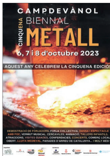
>> Cartell de la Biennial del Metall celebrada a l'octubre a Campdevànol.

A Ripoll, en el marc de la Fira de Santa Teresa, se celebra la Fira Catalana de l'Ovella des de l'any 1843. A Espinavell, el dia de Sant Eduard hi va haver un dels esdeveniments ramaders més esperats per la importància econòmica i turística, la Tria de Mulats. A Sant Pau de Segúries, el primer cap de setmana d'octubre s'organitzà la trobada de ramaders i agricultors que aposten per mecanismes regeneratius; la trobada, titulada Regenerando, va tenir lloc al mas La Sala. I encara una nota històrica referida al bestiar: les darreres recerques i troballes arqueològiques a la vall de Núria i a Ulldeter han posat de manifest que al Ripollès ja hi havia activitat ramadera d'alta muntanya fa més de sis mil anys.