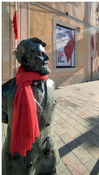
>> El FITAG ha sortit més que mai al carrer.

Cultura al carrer | Tot i l'omnipresència de les tecnologies digitals, els formats clàssics continuen transmetent cultura amb molt de vigor. Els teatres s'omplen. La 23a edició del FITAG ha convidat actors i grups de primera fila, tant nostrats com estrangers. Després de divuit anys sota la direcció de Martí Peraferrer, el festival es vol obrir