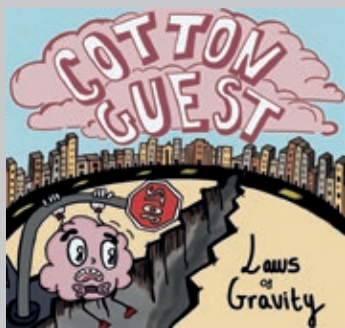
COTTON GUEST. Laws of Gravity . Cotton Guest, 2023.