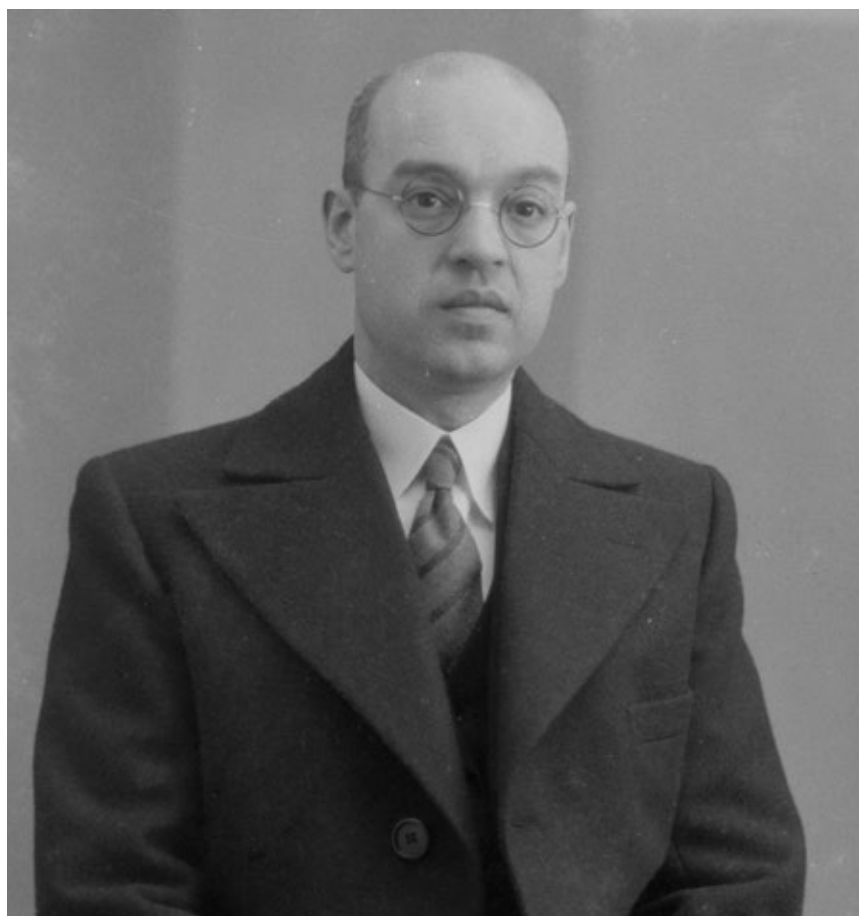
>> Jaume Bartrina, alcalde, diputat i assembleista.

Que dos dels deu protagonistes d'aquesta experiència fallida acabessin executats l'any 1936 en accions execrables representa el fracàs col·lectiu a la solució dels problemes derivats de la crisi de l'Estat espanyol contemporani i palesa el clima de violència a què van conduir les passions i les tensions socials en els primers quaranta anys del segle xx.