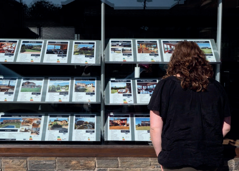
>> L'oferta immobiliària a la Cerdanya no para de créixer.

zacions» a final del segle XIX i principi del segle XX. Tot i que en trobaríem antecedents en èpoques anteriors, va ser en aquells moments que, a conseqüència de les transformacions que experimentaven les ciutats a causa de la industrialització, van aparèixer propostes residencials alternatives tant en les formes (la ciutat jardí) com en la ubicació (el suburbi, espais «sans» o «bells»). Això és el que fa dir a un altre estudiós, Robert Fishman, que «el suburbi és una utopia burgesa». En efecte, les primeres urbanitzacions en el sentit en què ens hi referim avui dia eren, ja ho matisarem, operacions immobiliàries de caràcter benestant; famílies burgeses que buscaven i trobaven uns espais agradables, tranquils i exclusius, sobretot per al repòs i les vacances, a una certa distància de les creixents tensions urbanes. I, de passada, suposaven una nova oportunitat d'inversió de capital d'origen industrial que havia de donar beneficis bons i ràpids.