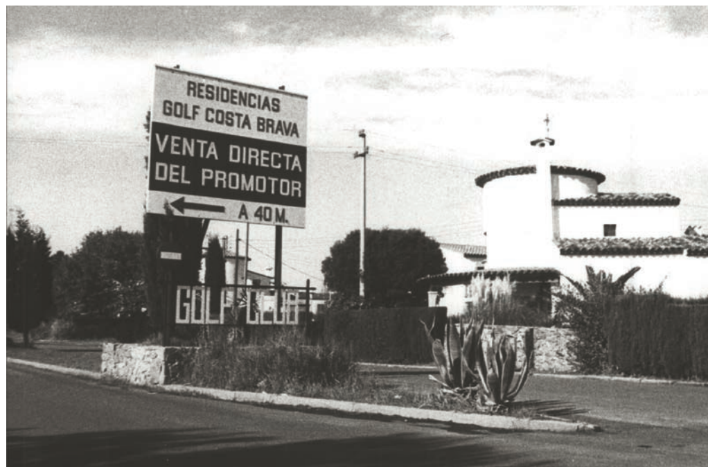
>> Promoció de la urbanització Golf Costa Brava a Santa Cristina d'Aro.