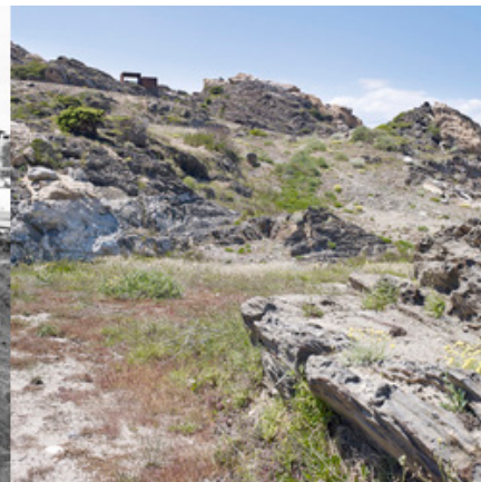
>> El Club Med, en el moment de degradació (a l'esquerra) i en el de deconstrucció i recuperació com a parc natural (a la dreta).