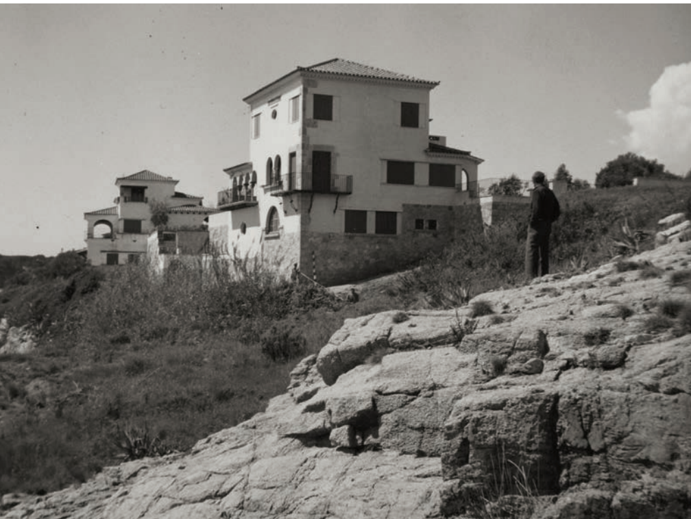
>> Obres d'urbanització als voltants dels xalets, a s'Agaró.