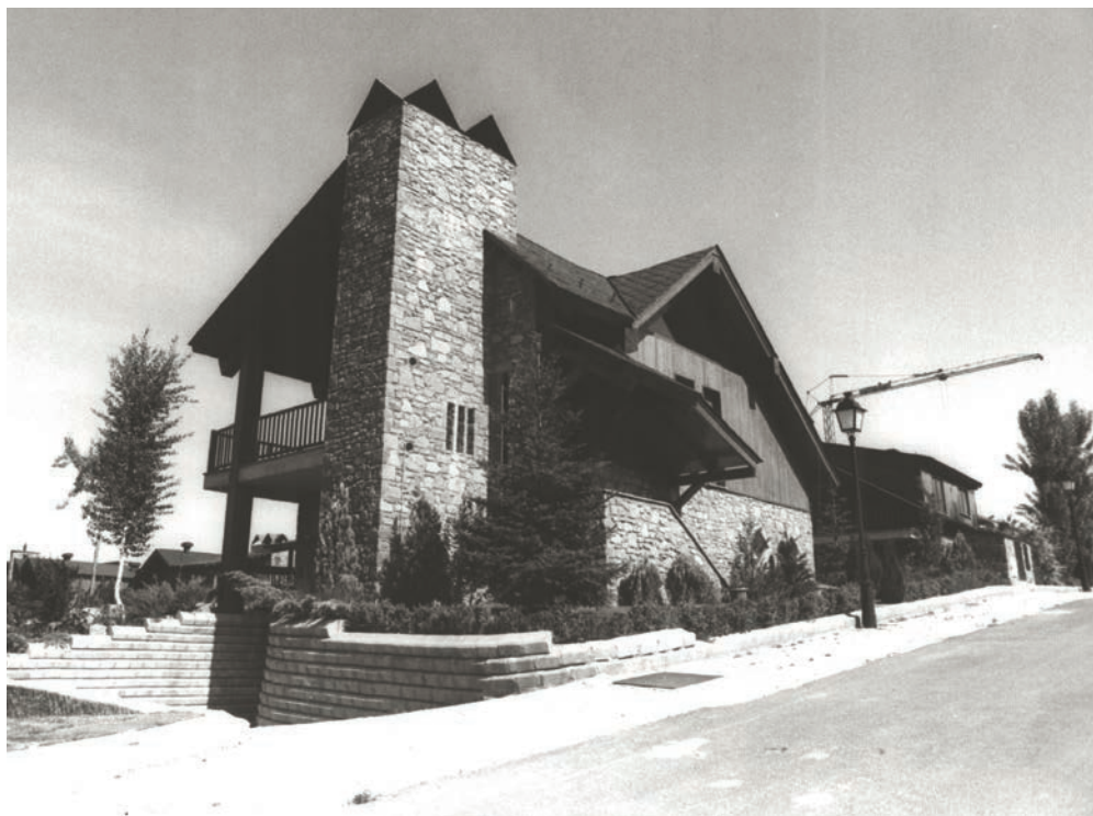
>> Segones residències a Puigcerdà.

Tornem, doncs, al discurs ideològic i de classes socials, i la seva vinculació amb l'urbanisme. La proposta de Howard i la seva ciutat jardí de base cooperativa va tenir molt d'impacte, pel seu fonament tant polític com formal. A molts llocs d'Europa van aparèixer projectes de ciutats jardí, encara que, com els casos esmentats, molts mancaven, precisament, de l'objectiu de transformació social i només mantenien la casa individual i el jardí particular com a emblema i caràcter de suburbi (sense el sentit pejoratiu que pot tenir ara). A Catalunya, aquest impacte és especialment perceptible, en totes les versions