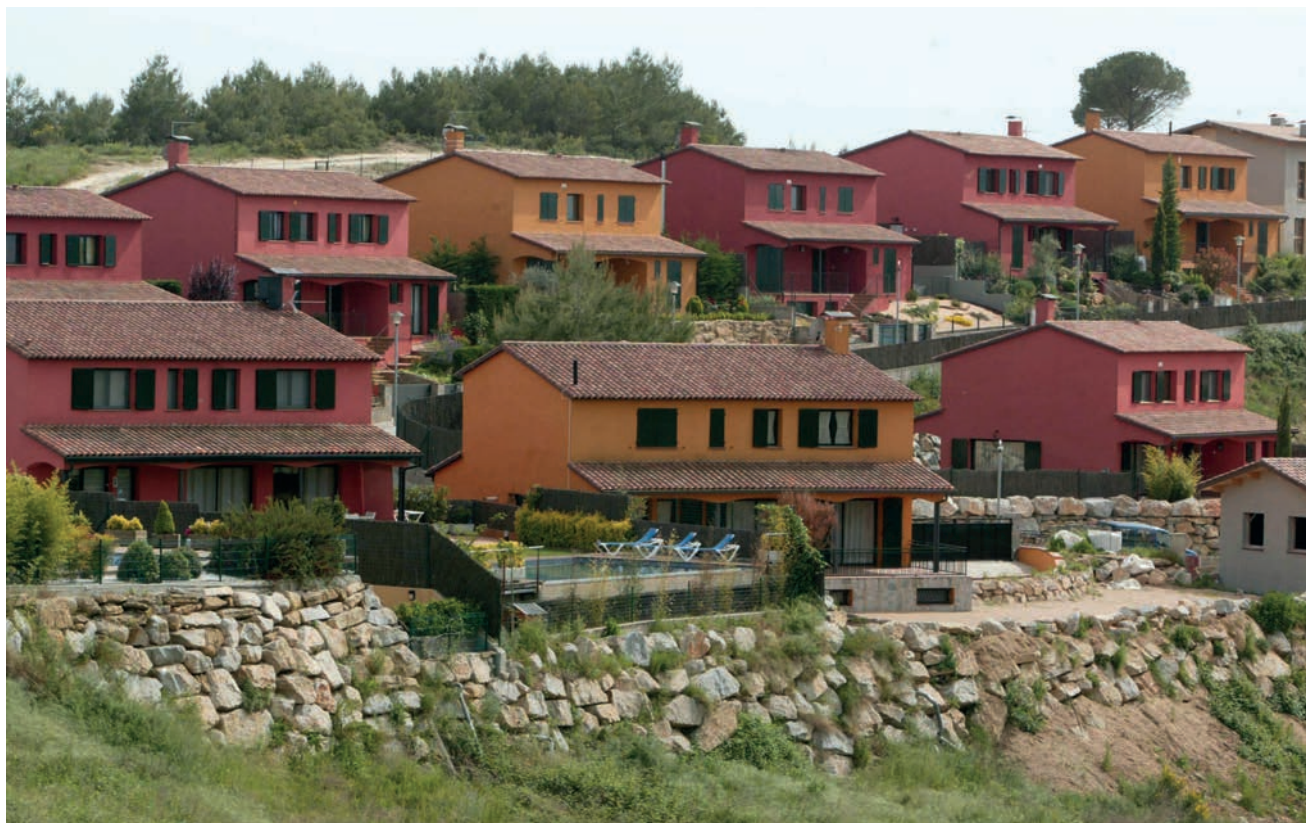
>> Urbanització del Golf Girona, al terme de Sant Julià de Ramis.