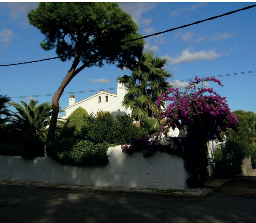
>> Finca del carrer Ametllers, on el Departament de Cultura no ha permès la construcció. Sant Feliu de Guíxols i s'Agaró / Castell-Platja d'Aro.

nya es van veure esquitxats de «planes parcials» (en la denominació de la nova Llei del sòl de 1956) que ocupaven segones línies costaneres, zones boscoses i vessants impossibles de muntanyes; des del cap de Creus fins a l'Ardenya, passant per les Guillerries, la Molina o el bell mig de les Gavarres. N'hi havia algunes que encara s'adreçaven clarament a les classes benestants, però també moltes que apel·laven a les creixents classes mitjanes, tant autòctones com estrangeres, que fixaven en la segona residència una de les seves aspiracions d'ascens social. Es fa difícil destacar-ne algunes entre tantes, si bé com a clarament excepcionals hem de parlar del Club Mediterrannée del 1962 al cap de Creus (i que dona molt més de si com a exemple de desurbanització) o, per altres motius, les urbanitzacions de començament dels anys seixanta de Pals o Santa Cristina d'Aro, vinculades al golf.