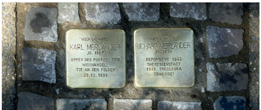
>> Llambordes de memòria davant la Villa Merländer, a Krefeld.