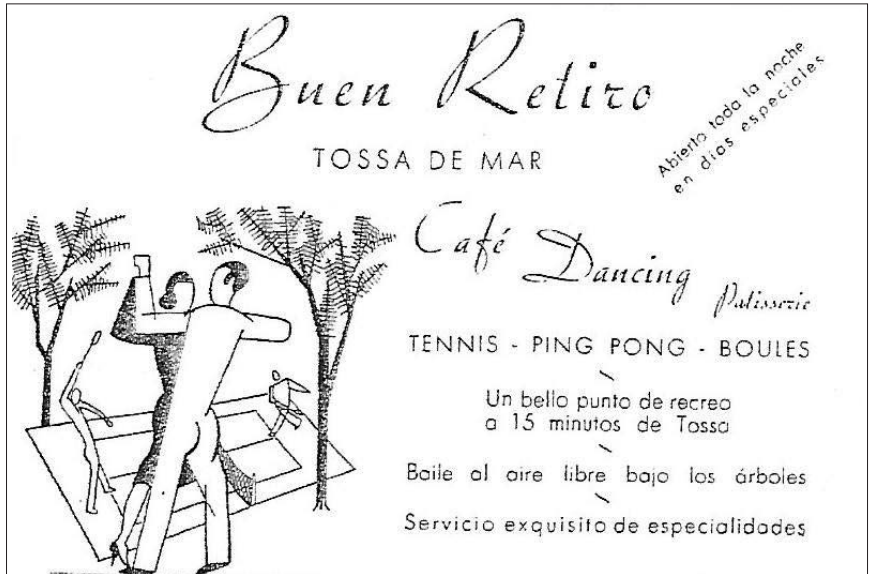
>> Targeta del Buen Retiro.