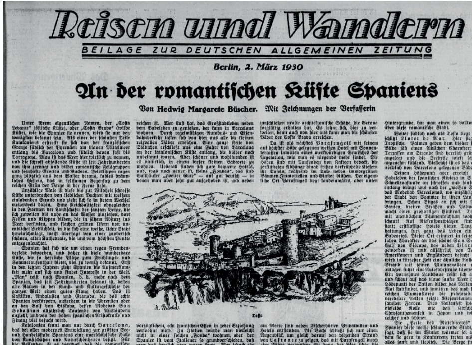
>> Portada i article del suplement Reisen und Wandern, del diari Deutsche Allgemeine Zeitung, en el qual el març de 1930 es parlava dels atractius de Tossa.