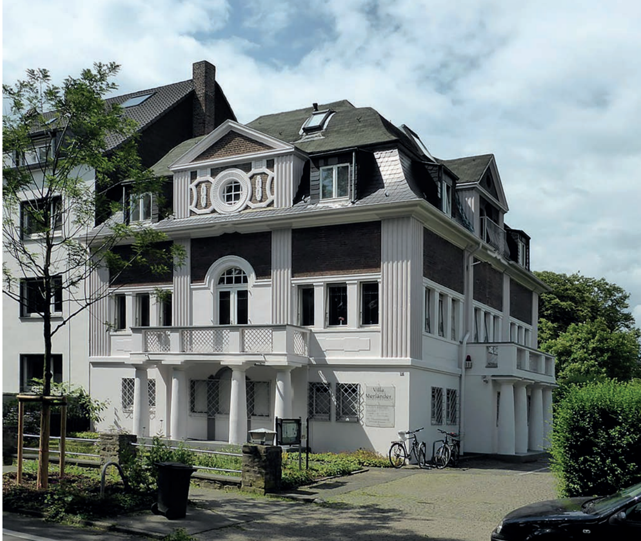
>> La Villa Merländer a Krefeld, seu actual del Centre de Documentació sobre el Nacionalsocialisme de la ciutat de Krefeld.