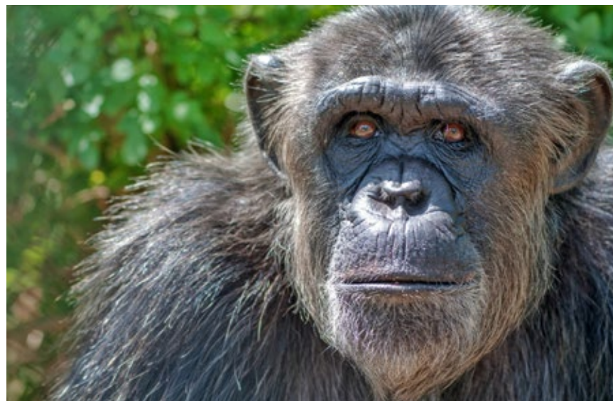
>> La ximpanzé Coco, actualment, a la Fundació Mona. Ara viu en un grup de sis ximpanzés.

Olga Feliu va quedar captivada per les mirades d'uns animals amb els quals compartim el 98 % dels gens