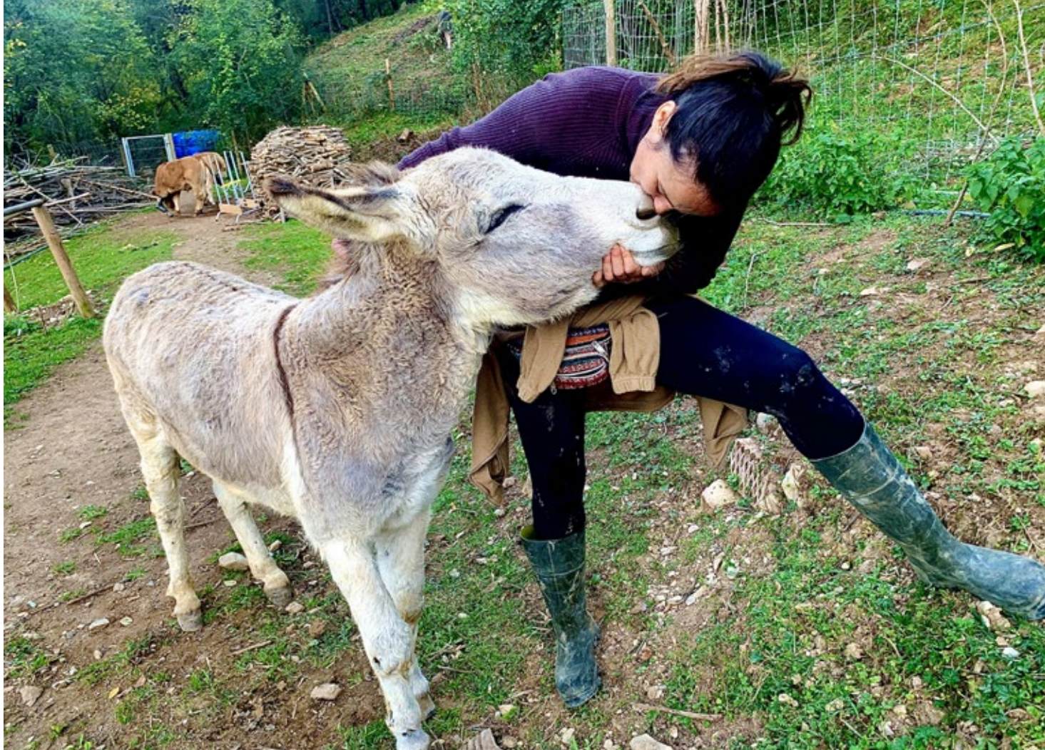
>> En Pepe, un ase rescatat d'un estable de Sanlúcar de Barrameda en condicions extremes: tenia les potes tan deteriorades que s'arrossegava amb els colzes.