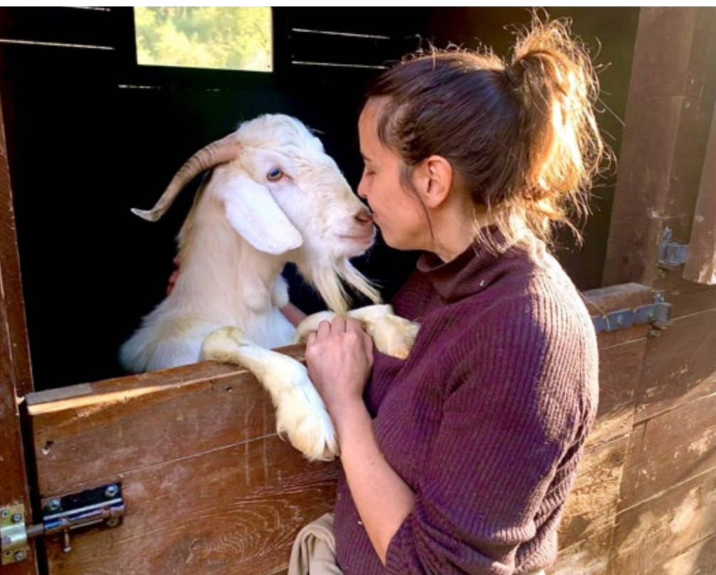
>> En Marcelo, una cabra rescatada d'una granja de Villena (Alacant), en quarantena mentre espera reunir-se amb la resta del ramat que acull el santuari.

Els darrers anys s'han alliberat vuit-centes cinquanta tortugues d'estany als parcs naturals dels Aiguamolls de l'Empordà i del Baix Ter, a l'estany de Banyoles i a diferents espais de la conca del Ter