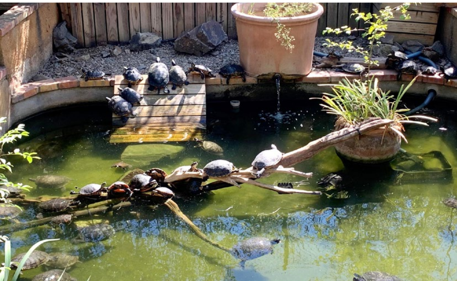
>> Tortugues de Florida, la comercialització de les quals es va prohibir l'any 2012. Moltes persones les alliberaven quan es cansaven de tenir-les, i així van anar envaint l'hàbitat de la tortuga d'estany, que està en perill d'extinció.

«Ara mateix, tenim una ràtio de 0,7 tortugues per hectàrea; el nostre objectiu és pujar-ne la densitat fins a tres tortugues per hectàrea», explica Budó. No hi ha dubte que, encara que sigui a pas de tortuga, ho aconseguiran.