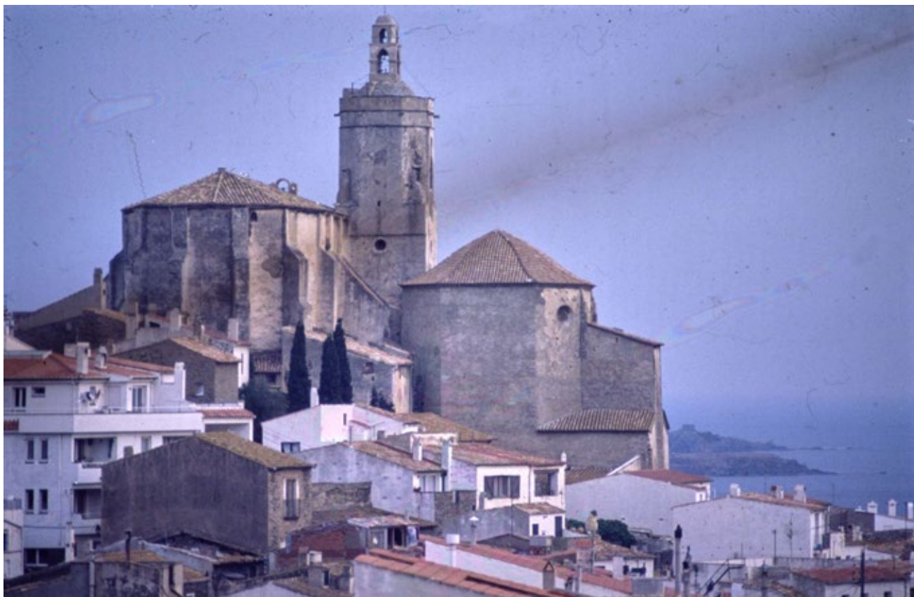
>> Vista parcial de Cadaqués, amb l'església de Santa Maria al fons, el 1989.

La família es va exiliar a la ciutat de Lió, on ella va continuar treballant de fotògrafa. El marit va ingressar com a empleat de la UNESCO a París l'any 1947 i aleshores van anar a viure a Vaucresson, als afores de la capital francesa. Mey Rahola va fer repetides visites en solitari a Catalunya a partir del 1946.