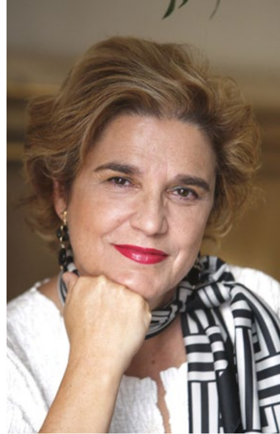
>> Pilar Rahola Martínez, el 2014.

El 27 d'agost del 1936 va arribar a la plaça de ses Herbes un camió amb milicians armats, que es van endur vuit cadaquesencs considerats de dretes, acusats de connivència amb l'alçament militar. Els van afusellar al castell de Figueres, sense judici. La matança es va reproduir arran dels