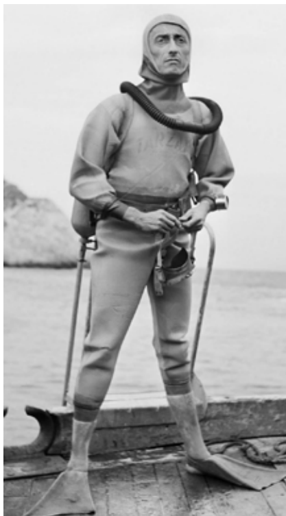
>> Jacques Cousteau a les Medes, el 1954.

va natural parcial marina de les illes Medes» i en regula l'administració i els usos. Pel que fa al submarinisme, actualment s'hi estableix un màxim d'immersions que es regulen segons