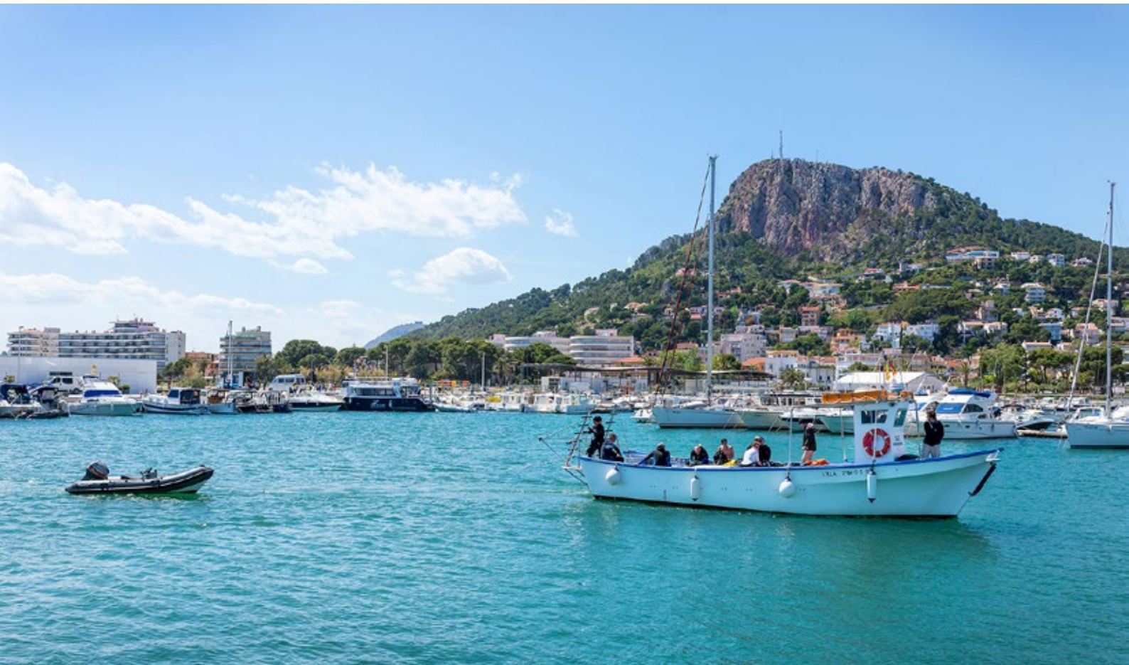
>> Una barca tornant d'una immersió.