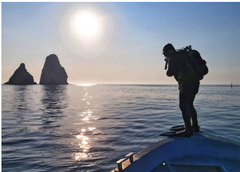
>> Submarinistes al vaixell.

holandesos i belgues, entre d'altres. El sector del turisme subaquàtic s'adreça específicament a les illes Medes i, probablement, no visitaria l'Estartit si no fos per practicar aquest esport.