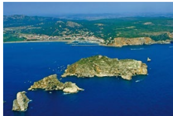
>> Les illes Medes.

A l'Estartit, l'Hotel Les Illes va començar a treballar amb submarinistes l'any 1982 i l'any 1985 va obrir el seu propi centre de busseig, com altres