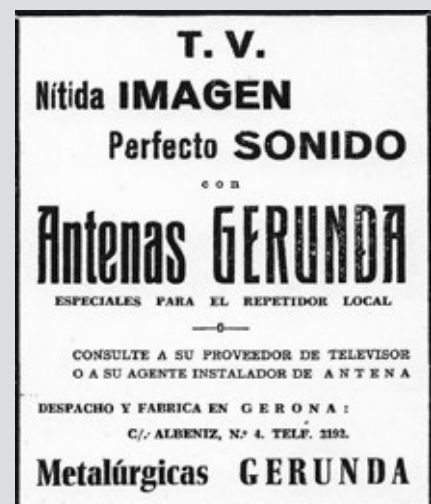
>> Metalúrgicas Gerunda va utilitzar per primera vegada el nom comercial Antenas Gerunda en un anunci publicat a Los Sitios el 2 de març de 1963.

En una bona decisió comercial, a partir de 1963 Metalúrgicas Gerunda va començar a utilitzar el nom d'Antenas Gerunda.