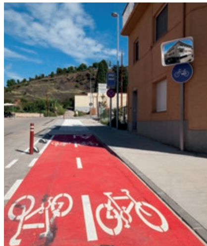
>> El carril bici del carrer del Pintor Domenge d'Olot.

La mobilitat és una gran consumidora d'energia i sembla que també és la responsable del 25 % dels gasos amb efecte d'hivernacle. Però les grans deficiències del transport públic, que ni tan sols passa per diverses poblacions de la comarca i per les altres ciutadania a emprar el vehicle privat. Segons les estadístiques, l'ocupació dels vehicles privats és, de mitjana, d'una persona i mitja. Els responsables comarcals proposen tot d'alternatives, des d'utilitzar més la bicicleta fins a optimitzar recorreguts, compartir vehicle o planificar els desplaçaments per no haver-los de duplicar i crear un transport col·lectiu que reculli els treballadors a diferents punts fins als polígons on treballin. Ara també disposem de vehicles elèctrics, més eficients des del punt de vista energètic, i que tenen l'avantatge de reduir tant el soroll com les emissions. Però tothom és conscient de la complicació de fer-ho viable, i la voluntat de fer de la Garrotxa una comarca més sostenible, ara per ara, és un desig i prou.