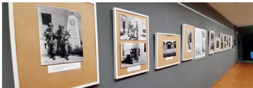
>> Instantània de l'exposició «Fer el servei a Puigcerdà el 1958», a l'Arxiu Comarcal de la Cerdanya.

Aquesta donació va resultar en l'exposició «Fer el servei a Puigcerdà el 1958», que es va poder visitar entre els mesos d'agost i setembre a sala Sebastià Bosom de l'Arxiu Comarcal de la Cerdanya. Si us la vau perdre, el conjunt d'imatges digitalitzades es poden consultar al cercador d'Arxius en línia de la Generalitat de Catalunya.