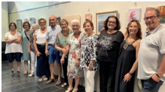
>> Membres del Cercle Artístic de Palamós.

en l'àmbit mediàtic, tot i que fan una feina molt lluada i, sovint, terapèutica. Perquè l'art, i la cultura en general, en les seves diferents versions, amateurs o professionals, té efectes provats sobre la ment, les emocions i la fisiologia humana. I segur que, entre les persones que assisteixen als cursos d'aquesta entitat i d'altres de semblants, hi ha artistes potencials que no destacarien si no se'ls donés una oportunitat d'expressar-se. Enhorabona i endavant!