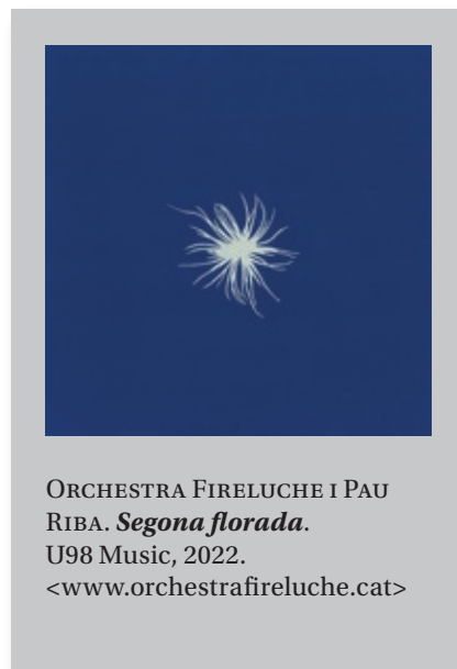
ORCHESTRA FIRELUCHE I PAU RIBA. Segona florada . U98 Music, 2022. <www.orchestrafireluche.cat>

En altres temes hi trobem referències molt ribianes , com a «Ha explotat el Big Band» o a «La deu còsmica», al costat d'alguna peça de la tradició popular com «Minyona de Reus» o el bellíssim poema de Salvat-Papasseit «Dona'm la mà».