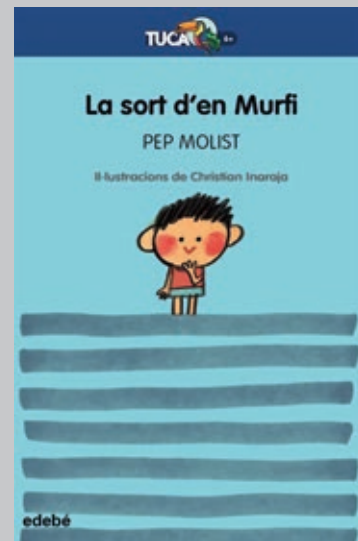
MOLIST, Pep. La sort d'en Murfi . Barcelona: Edebé, 2022. 45 p.

El canvi, sens dubte, és un tema central a El dia de l'esquerda , juntament amb el buit i l'oblit, o l'amistat i la tolerància, que Bosch tracta amb destresa estilística i pinzellades d'ironia. I, com a mostra, aquesta descripció de la Univers: «Ella era un canvi permanent dels bons, com una cabellera al vent que emergeix d'una calba indigna». Llaminer, oi?