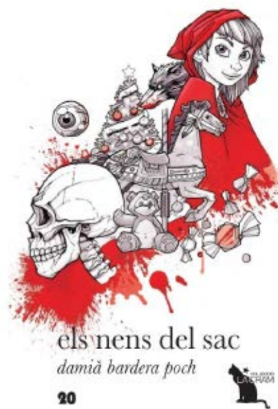
>> Coberta d'Els nens del sac.