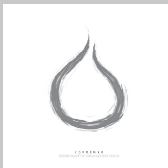
COPDEMAR. Diferents maneres de somicar amb certa dignitat . Saltamarges, Navalla, Pa i Raïm, Subpost, 2022.