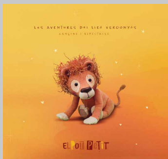
EL POT PETIT. Les aventures del lleó vergonyós . U98 Music, 2021.

(Aleix Bou). A alguns melòmans sense sentit de l'humor Ludwig els pot semblar una perversió, però és molt més sa i entretingut endinsar-se sense prejudicis en aquesta obra única, creada per un músic lliurepensador, tot un clàssic del nostre temps.