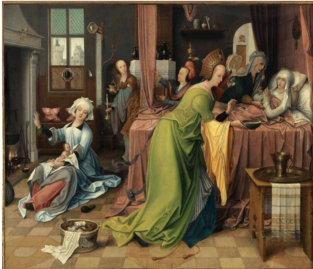
>> El naixement de la Mare de Déu (ca. 1520), oli sobre taula de Jan de Beer que custodia el Museu Nacional Thyssen-Bornemisza de Madrid, i que mostra el treball i l'instrumental de les llevadores.

El gran salt quantitatiu i qualitatiu, però, es produeix a partir del segle XIX, amb la sistematització de la presència de les dones en els centres d'estudis superiors europeus i colonials