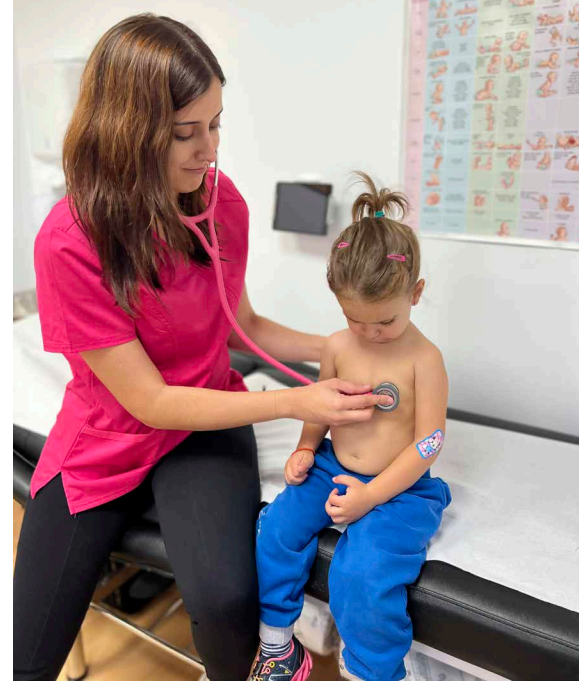
>> En l'assistència pediàtrica la proximitat pot ser un valor afegit.

En els llibres de medicina i història de la medicina, costa més trobar caps rectors femenins. L'any 2020, de 222 persones guardonades amb el Premi Nobel