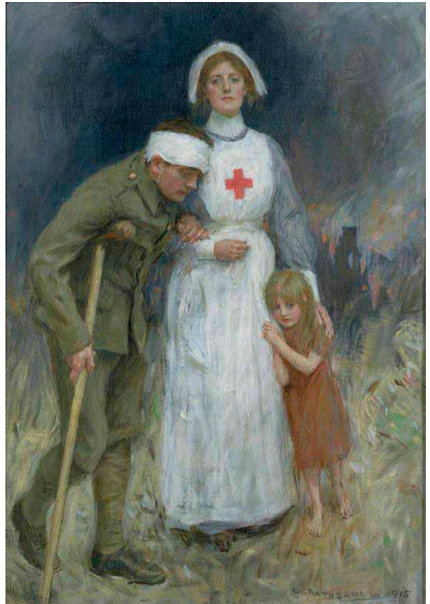
>> Pintura de William Hatherell, per a un cartell de l'any 1915 en què, en un escenari de ruïna bèl·lica, la infermera apareix com a únic suport d'un soldat ferit i d'una nena abandonada.

diis infantium (1472), del catedràtic paduà Paolo Bagellardo; Kinderbüchlein (1473), del metge bavarès Bartholomäus Metlinger, reeditat com a Ein Regiment der Jungerkinder ; un compendi (1483) del flamenc Cornelius Roelans; i el poema didàctic Versehung des Leibs (compost el 1429, publicat el 1491), del benedictí suau Heinrich von Louffenburg.