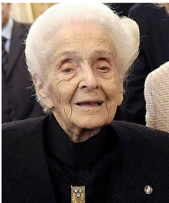
>> La neuròloga jueva sefardita italiana Rita Levi-Montalcini, coguanyadora del Premi Nobel de Medicina l'any 1986 per la seva investigació sobre el factor del creixement del nervi.