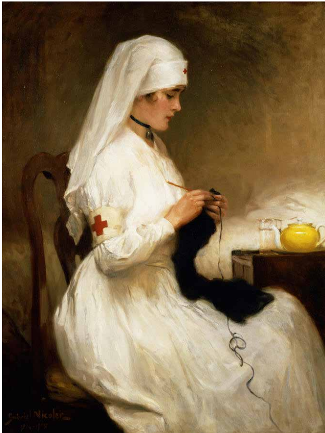
>> Retrat d'una infermera de la Creu Roja de Gabriel Nicolet, de l'any 1914-15, en què la sanitària afegeix al seu carisma assistencial el compliment d'una petició que la institució a la qual representa havia fet a la població: teixir roba gruixuda per als soldats que patien un fred espantós a les trinxeres de la Primera Guerra Mundial.