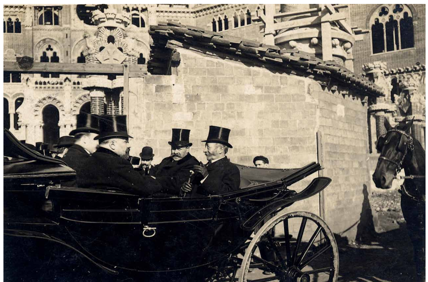
>> Les Toulousains de Toulouse de viatge a Barcelona, davant les obres de l'Hospital de Sant Pau, acompanyats de les autoritats, el desembre de 1908.

JOAN RAMON RESINA, pròleg a La voluntat clàssica de Catalunya. El paper del jaciment arqueològic d'Empúries en la construcció del nacionalisme català: Prat de la Riba, Eugeni d'Ors i el Noucentisme , de PAU GUINART LÓPEZ