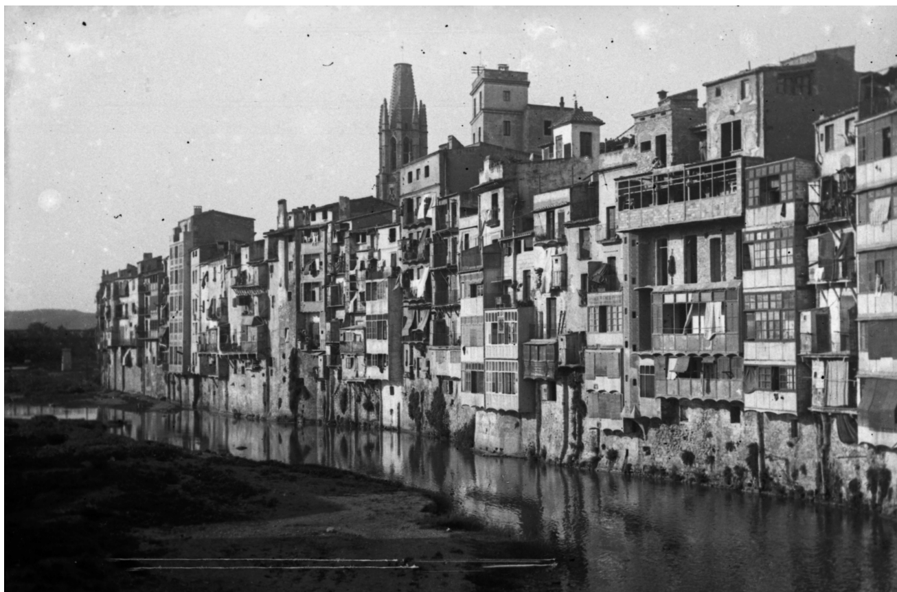
>> Les cases de l'Onyar, a Girona, cap al 1910, amb la Casa Masó en obres, durant la primera fase de la reforma que en va fer l'arquitecte Rafael Masó.

un fenomen que s'ha intensificat molt a partir dels repositoris digitals. La troballa casual d'unes fotografies de Girona inèdites, en el curs d'una altra recerca, va ser l'origen del treball que presentem.