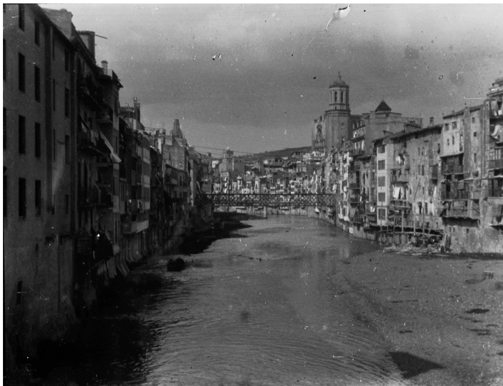
>> Cases a la vora de l'Onyar, a Girona, cap al 1910.

Per a Caroline Barrera, autora d'un estudi titulat Les sociétés savantes au XIXe siècle, une sociabilité exceptionnelle , publicat el 2004, Les Toulosains és un fruit tardà de l'eclosió d'enti-