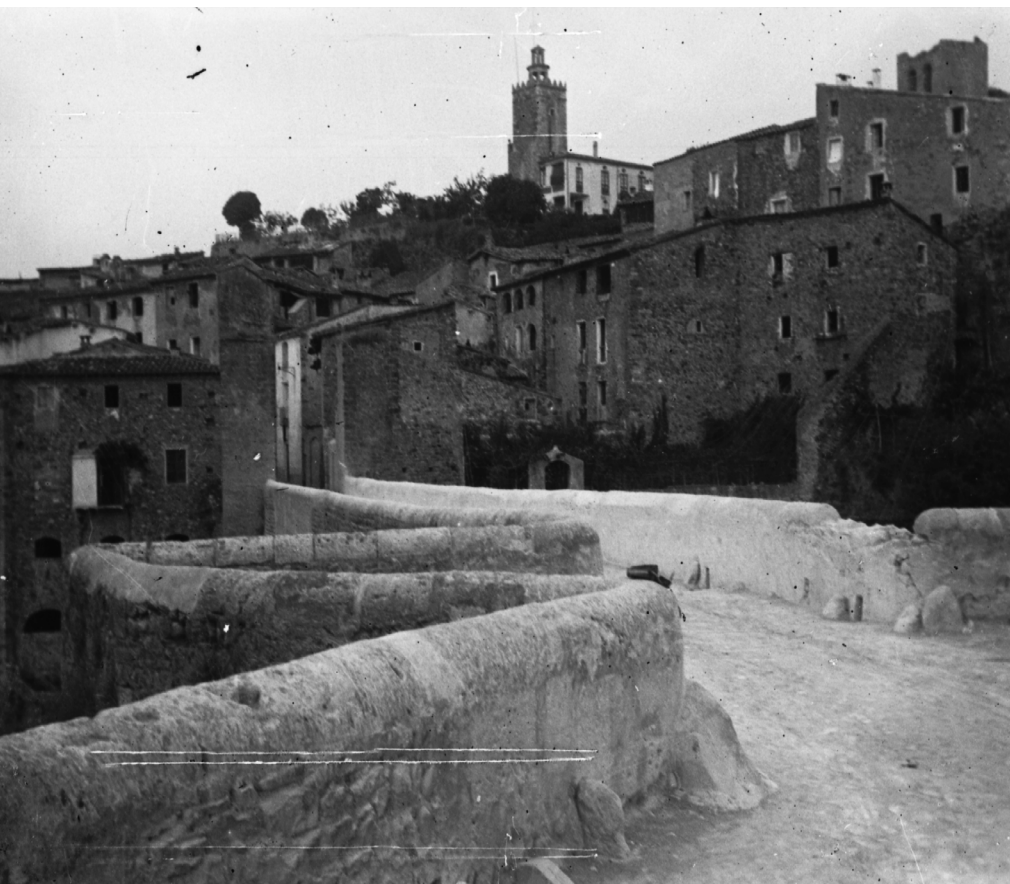
>> El pont de Besalú abans de la restauració de 1965, cap al 1910.

A més, hem localitzat en el fons unes imatges que documenten la visita de Les Toulousains a Barcelona, el 1908. Concretament, els participants van ser fotografiats davant de les obres de l'Hospital de Sant Pau de Barcelona. Sens dubte, l'estructura revolucionària en pavellons del nou