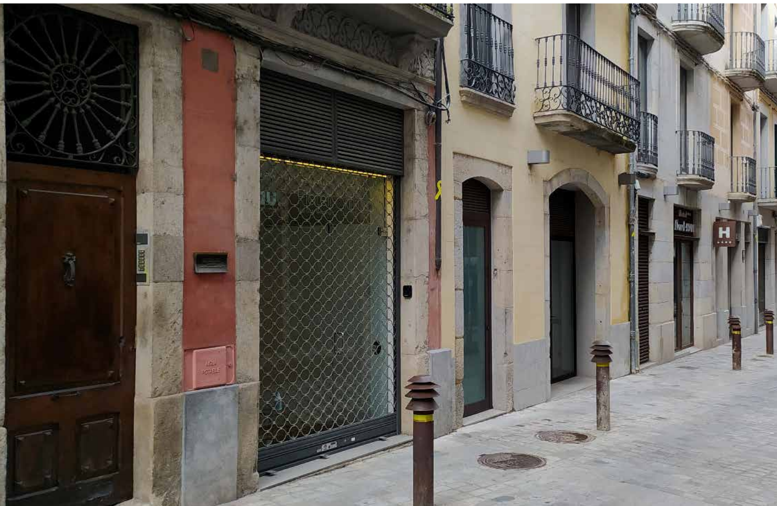
>> En primer terme, el número 3 del carrer del Nord de Girona, on estava ubicada l'escola de Sánchez.

apareix novament en molts mitjans escrits d'arreu de l'Estat, entre els quals trobem els gironins La Lucha i La Província . I el periòdic El Integrista afegeix: «Aprendan con este ejemplo los vecinos de Calonge que la siguieron y creyeron...».