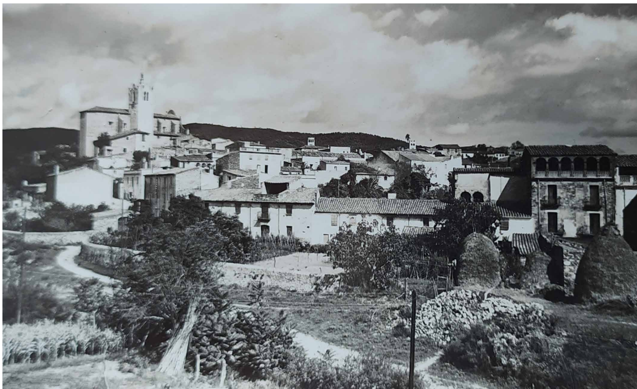
>> Vista general de Calonge.

i vint-i-un dies de presó correccional per escarni als dogmes de l'Església.