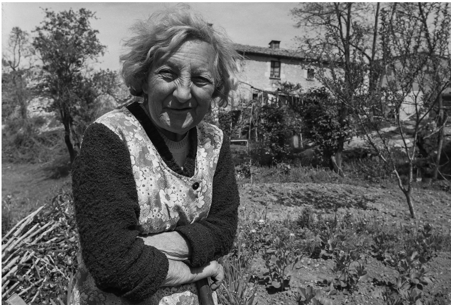
>> La pastora, a l'exterior de la seva masia.

més en l'ànima de la pastora, que està plegada de braços i fa una ganyota que mig amaga un somriure. Aquesta imatge, precisament, és la que el fotògraf va incloure en la sèrie «Persones» el 2013, en què recopilava un seguit de retrats que s'allunyen volgudament del retrat convencional, sense escapar-se, però, de l'essència: reproducció, psicologia i identitat. S'hi intueix la voluntat de l'autor d'emfatitzar la singularitat de l'individu en el seu medi, amb els seus avituallaments i amb totes les peculiaritats del seu món.