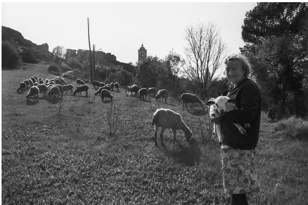
>> Amb un anyell en braços i la Catedral al fons.