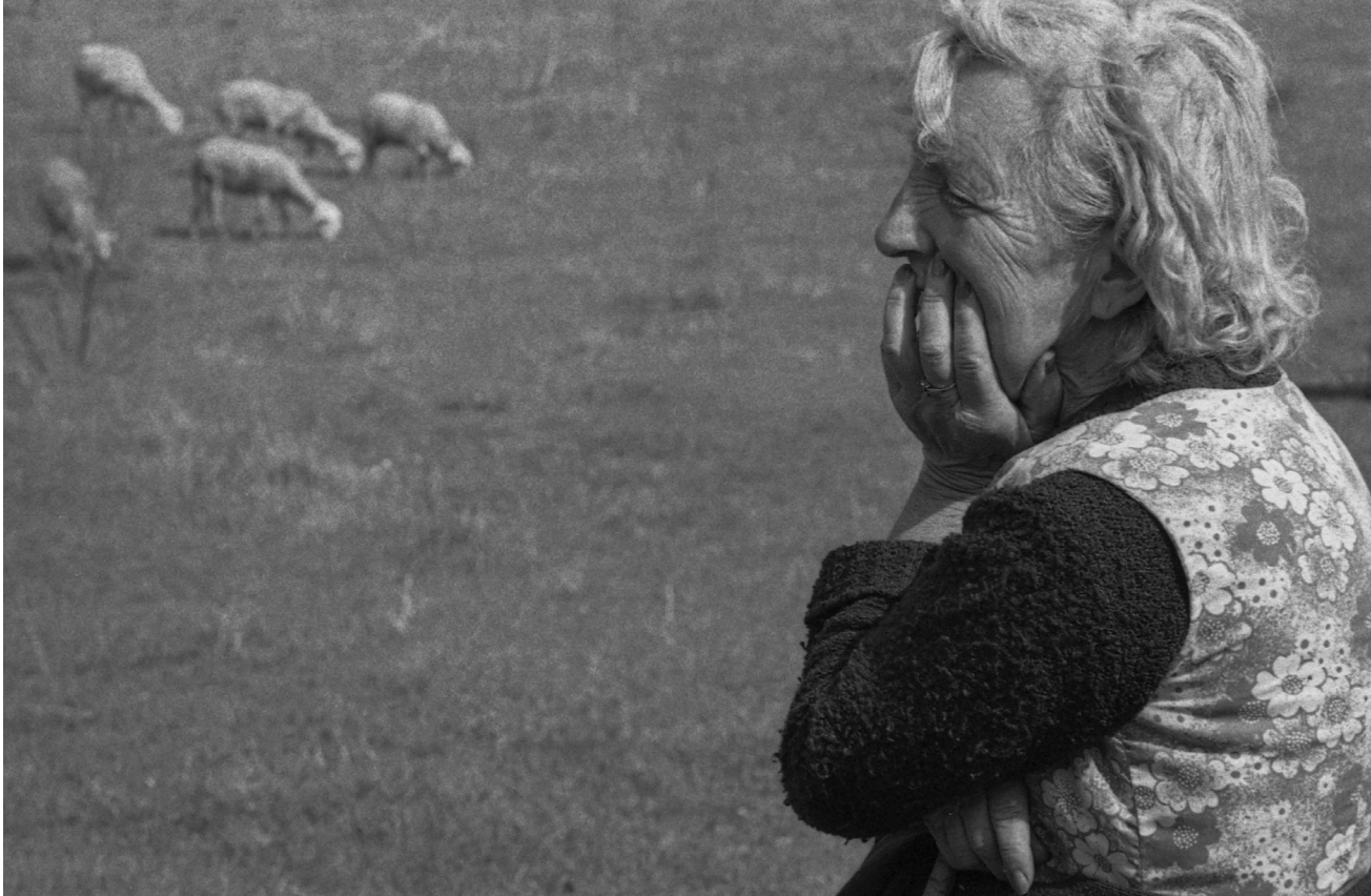
>> La pastora, pensativa, mentre les ovelles pasturen.

En la fotografia humanista, els carrers i les persones anònimes passen a ser l'escenari i el contingut preferents. Aquestes imatges tenen sovint com a destinació final les revistes il·lustrades més insignes de l'època, com ara Vu , Paris Match , etc. El tema, per tant, interessa als fotògrafs, però també als consumidors d'aquestes revistes, en les quals té molt bona acollida.