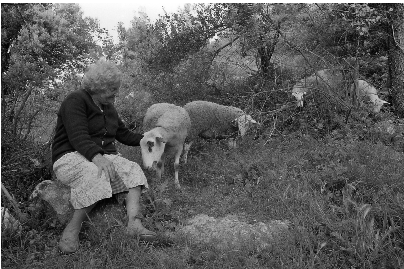
>> Asseguda, acaronent una ovella.

Jordi S. Carrera és un fotògraf amb un marcat caire urbà que s'interessa en aquesta ocasió per un tema rural, la pastora de Torre Gironella, de la qual tenim força informació des de la publicació de l'article d'Anna Sánchez en