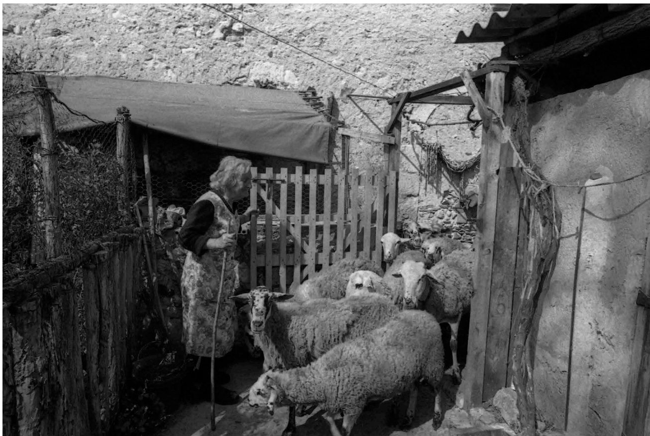
>> Obrint la porta al ramat.