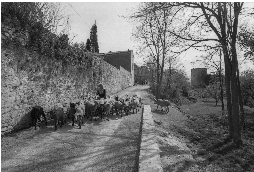
>> La pastora i el seu ramat.

projecte. Entre aquestes fotografies, n'hi ha que provenen de noms ben destacats, com els fotògrafs que van treballar en els anys trenta per a la Farm Security Administration amb