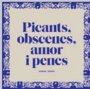
GERMÀ NEGRE. Picants, obscenes, amor i penes . Halley Records, 2021.