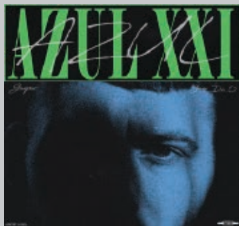
GASPAR. Azul XXI . Gaspar, 2021.

alguna treva —per exemple, la balada final que dona títol al disc. Completat amb aportacions de diversos músics entre Blanes i Palma, Deky és un punt i a part en la trajectòria tan brillant com imprevisible d'Isaac Ulam.