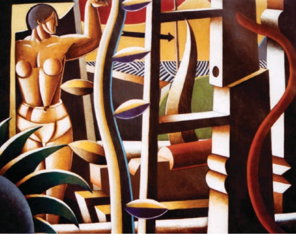
>> Sota un cel estrany, 2008, 162 x 130 cm, acrílic-tela.

tura creativa que no sigui la de seguir un propi flux harmònic personalitzat per la llibertat i pel pòsit adquirit en un buf evocador, lleu, oxigenador, dels temps passats.