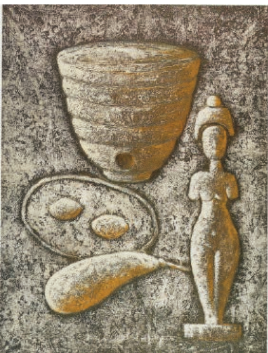
>> Natura morta amb llum blanca, 1991, 116 x 89 cm, acrílic sobre tela.

comercialització de l'art que sovint mortifica la professionalitat de l'artista; pocs artistes actuals, sigui pel que sigui, sovint per la desaparició sistemàtica dels espais d'art mercantils, poden exhibir en una galeria amiga que els correspongui i els alliberi de la feixuga tasca del «comerç».