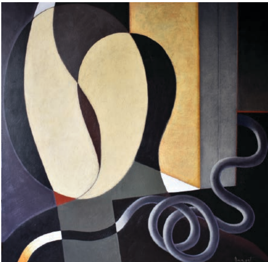
>> Entre el mirall i el mur, 2017, 100 x 100 cm, acrílic sobre tela.

xx només exhibeixen una profunda ignorància. Un artista, com Amagat em diu que deia Isidre Nonell, és un home amb un ciri encès que s'afegeix a una processó de ciris encesos, i l'últim és l'últim, i la filera pot tenir més o menys ziga-zagues; d'aquesta imatge se'n poden fer tantes lectures com calgui, però la pintura sempre parla de la pintura i no cal voler-la antropològica, ni periodística, ni treure-la d'on es mou ara i sempre.