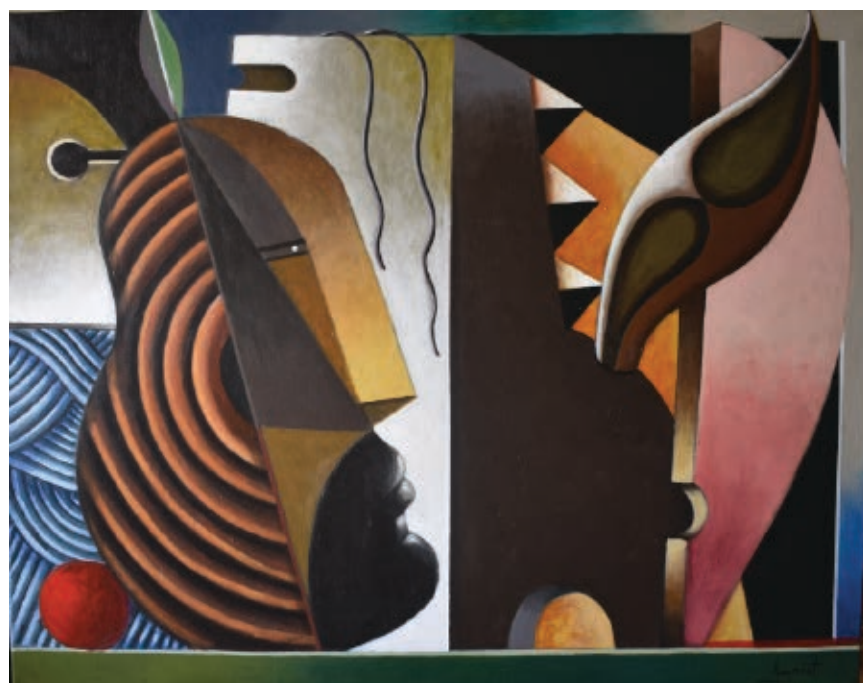
>> Punt de trobada, 2013-2016, 73 x 92 cm, acrílic-tela.