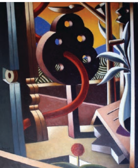
>> Arbre amb ombra, 2006, 55 x 46 cm, acrílic sobre tela.

lona, on periòdicament exposa la seva obra recent (i ja en porta set) i des d'on pot arribar a uns públics que, a hores d'ara, no són gaire evidents ni propers. Convenim que la simbiosi Sala Dalmau - Jordi Amagat no deixa de ser fructífera en tots els ordres i que d'algun manera resol aquest escull de la