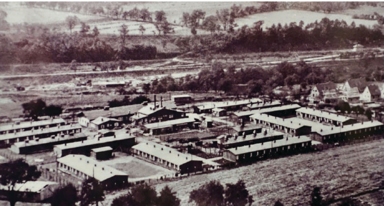
>> Kommando de Ternberg, camp annex de Mauthausen.