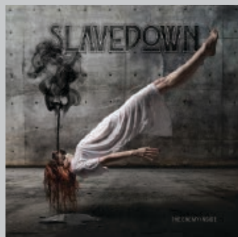
SLAVEDOWN. The enemy inside. La Família Revolució, 2021.