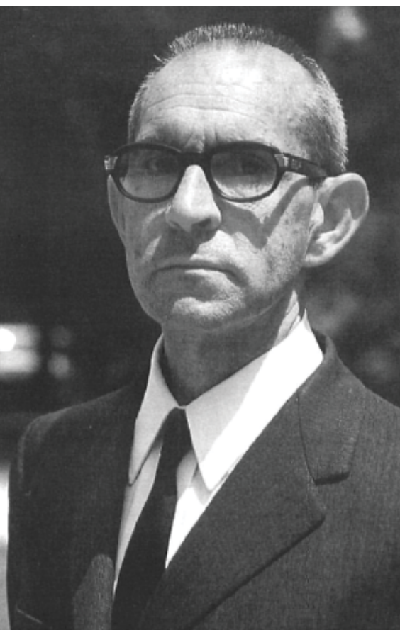
>> Salvador Espriu als anys seixanta.

Una altra enumeració remarcable és la que inclou el conte «Nervis», del mateix recull, que sintetitza la mercaderia que anuncia un venedor de periòdics, i que es manté actual després de més de vuitanta anys: «Corrupció, barroeria, violència, guerres, crims, malestar social, inflació pels núvols, estadístiques manipulades, triomfalisme sorneguer, còmplice arribisme