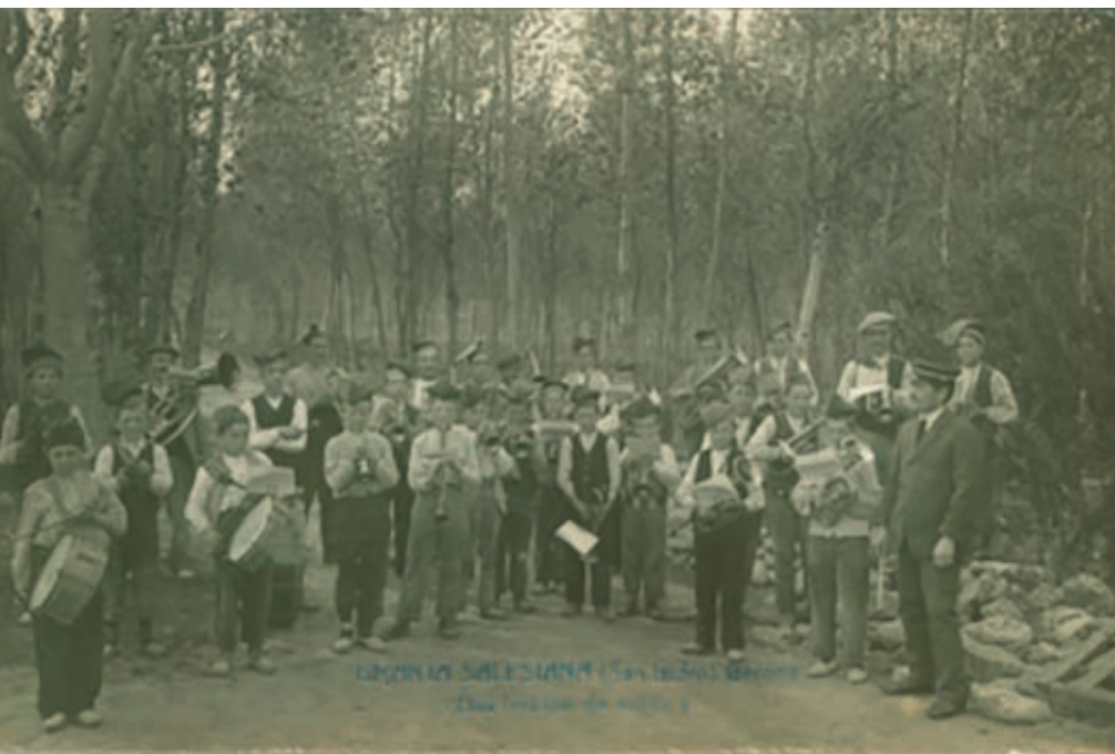
>> Alumnes de la Granja Salesiana Sant Isidre de Girona durant una classe de música a l'exterior, a principis de segle xx.

cació, com ho feia també la Casa de Misericòrdia a Girona a mitjans del segle XIX. El mestre Carreras Dagas ja havia impulsat una escola de música a Girona el 1848, de breu durada, i en traslladar-se a la Bisbal el 1880 en bastí una altra que, com a Peralada, fou gresol de músics, com els que van acabar formant una altra cobla històrica, la Principal de la Bisbal.