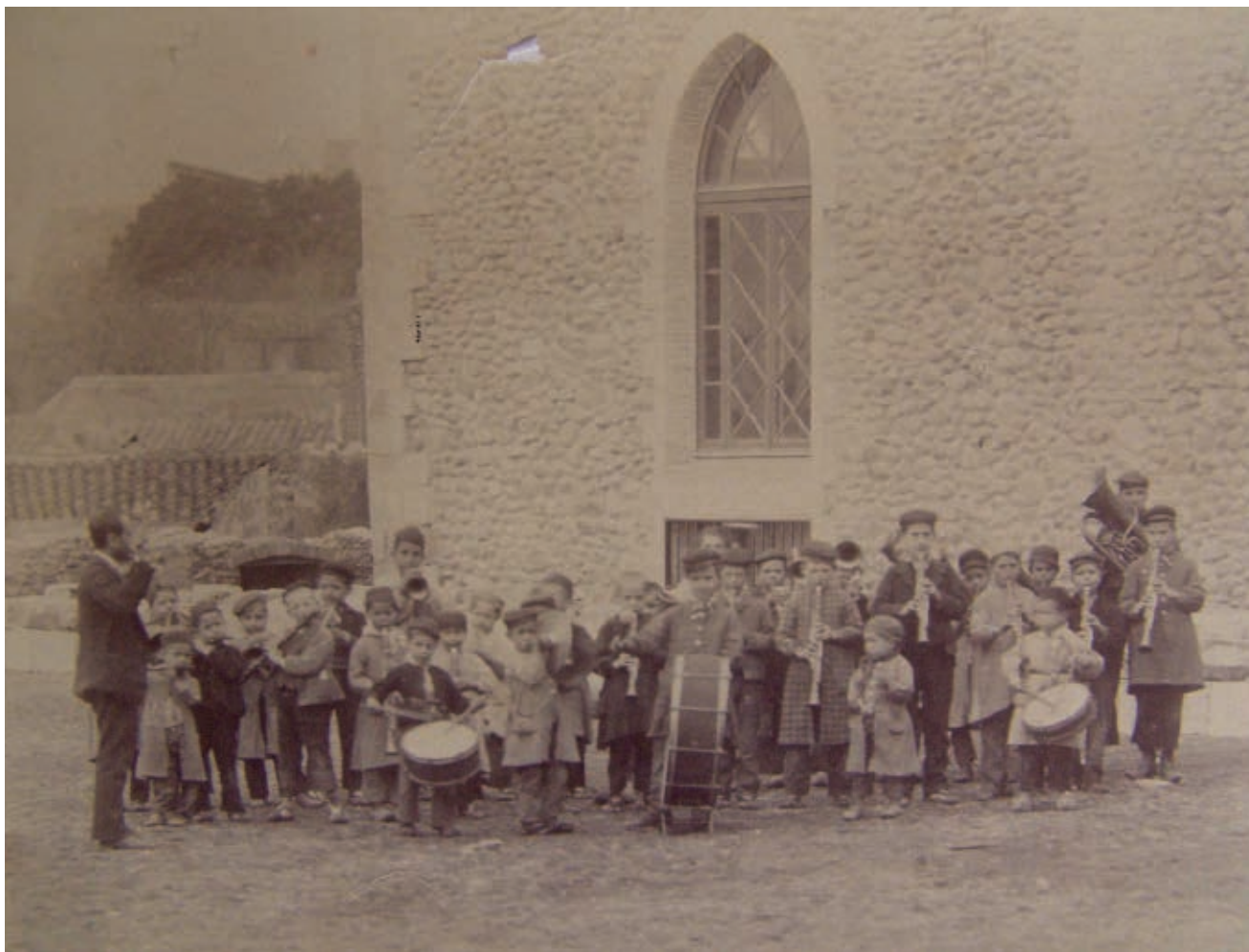
>> L'escola de música de Peralada, a finals del segle XIX.

com ho van ser els Rodil a Figueres, els Tomàs i Maimí a la Bisbal, els Serra a Banyoles, o els olotins Anglada, Barberí, Camps, Casademunt, Lamarca, Llor, Moy, Parella, Planella, Roca o Mel, Sala i tants altres. Era una formació encarada cap a l'instrument, tot i que no descartava l'aprenentatge de la solfa, que els possibilitava la col·laboració amb els mestres de capella, quan demanaven reforços per a festivitats especials.