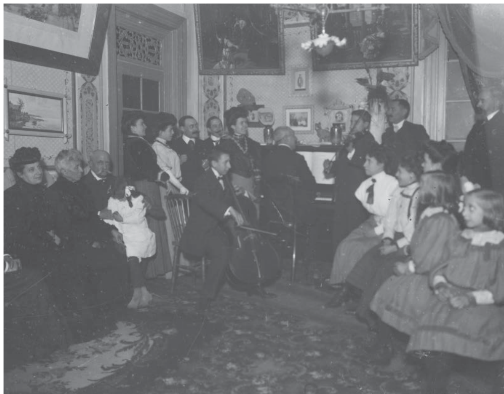
>> Una audició musical a casa de la família Audouard, a la Girona de 1915.

Però encara faltava temps perquè els ideals de Baldri Reixac d'introduir la música dins l'educació general s'acomplissin. Per bé que l'ensenyament primari fou obligatori des del 1857 amb la Llei Moyano, la música no s'hi va preveure fins ben entrat el segle XX. L'Escola Normal de Girona va començar a formar musicalment els mestres a par-