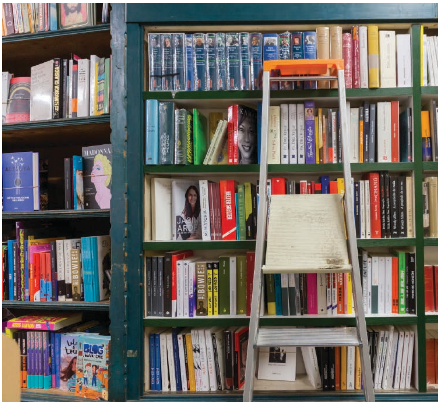
>> Lleiex d'una llibreria, amb volums de l'Obra Completa de Josep Pla a l'extrem dret.