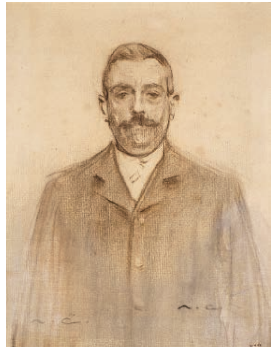
>> Retrat dibuixat de l'escriptor, a càrrec del seu amic Ramon Casas.