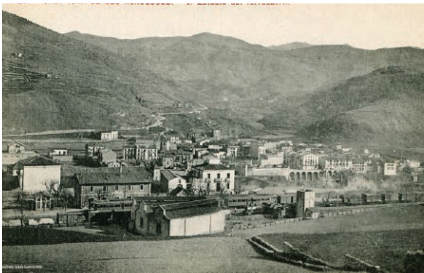
>> Sant Joan de les Abadesses, amb l'estació en primer terme, a principis del segle xx.

Els motius eren diversos i difícils de desentrellar, però tots els indicis ens situen en els primers dies de l'anomenada Setmana Tràgica, durant la qual Raimon Casellas va patir un incident que el va colpir profundament. Tot va