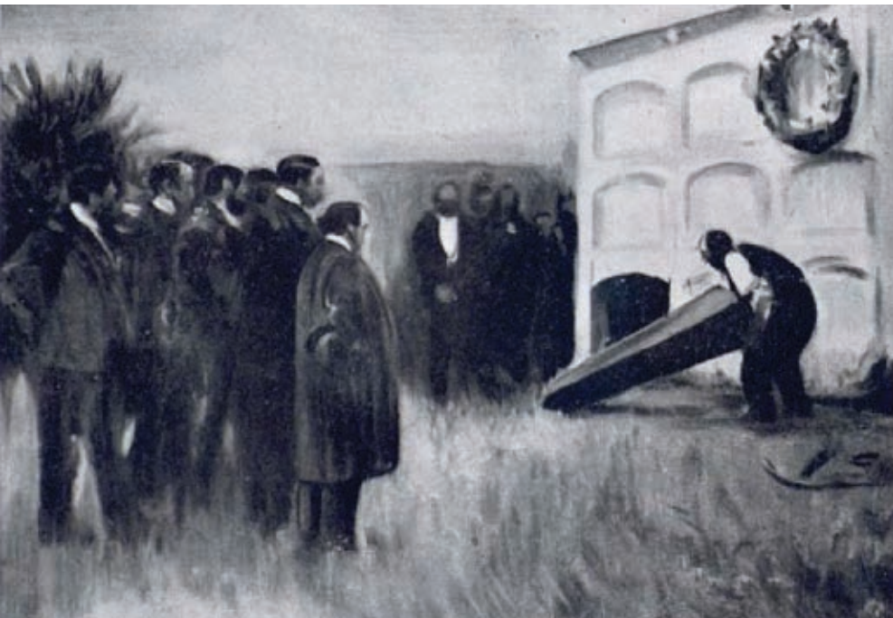
>> Quadre del pintor Ramon Casas sobre l'enterrament.