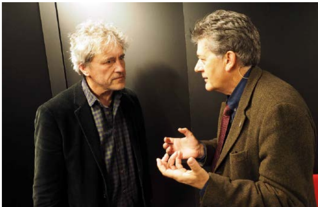
>> Amb l'escriptor gallec Manuel Rivas al MOT de 2017.