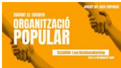
>> Cartell de la Xarxa Solidària del Baix Empordà.

van mal dades un altre cop, aquesta empenta de solidaritat hauria de continuar. Seria un bon senyal que, davant l'adversitat inevitable, haguéssim après unes quantes lliçons i que iniciatives com la de la xarxa solidària de joves haguessin nascut per tenir continuïtat.