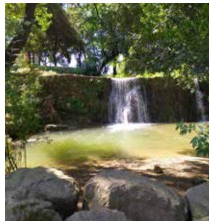
>> No és habitual veure tanta aigua a la resclosa de Can Bach, a la riera de la Pera, de Flaçà.

Retorn a la natura | Si la pandèmia serà o no serà un revulsiu a la insensatesa humana, deixem-ho per als sociòlegs. Que és com dir posar l'economia en mans dels economistes. Una cosa és segura: la recuperació d'espais naturals pel sol fet d'haver estat uns mesos sense patir l'acció de l' Homo sapiens , que, pel que s'ha vist, no és tan sapiens . Feia goig, aquesta primavera, veure amb quina ufana creixien les plantes, com verdejaven els camps i com rajava l'aigua per totes bandes, fins i tot en llocs poc habituals i ben a prop de Girona. La natura és sàvia, i no cal gaire ecologia de despatx per veure-la venir, com saben els pagesos de tota la vida. Per això sorprèn la virulència amb què han reaccionat certs naturalistes a unes obres a la llera de l'Onyar, vora el pont de Pedra. Hi calia una intervenció per netejar un col·lector de sanejament i, naturalment, la maquinària hi havia d'accedir.