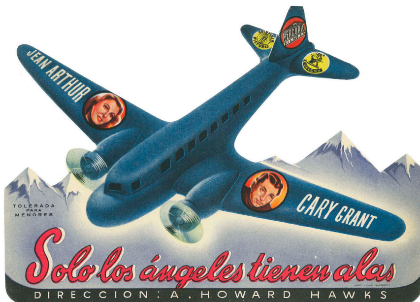
>> Jean Arthur i Cary Grant, protagonistes de Sólo los ángeles tienen alas.