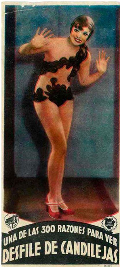
>> Joan Blondell en un programa de Desfile de Candilejas.