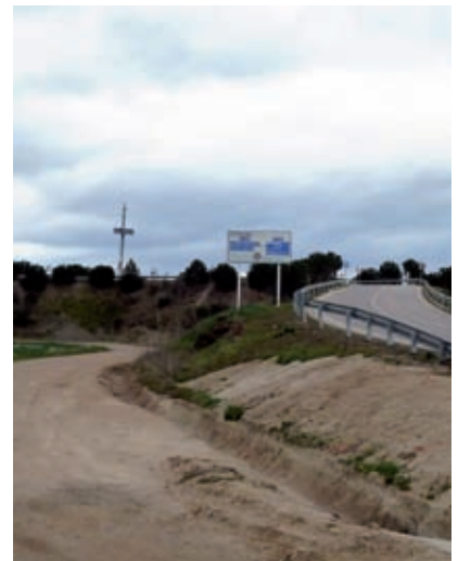
>> Pas elevat de Sant Grau.

El nostre objectiu ara són les actuacions infraestructurals que podem qualificar de «menors», on es detecten greuges evitables i, sovint, una desproporció entre les mesures adoptades i els objectius a resoldre