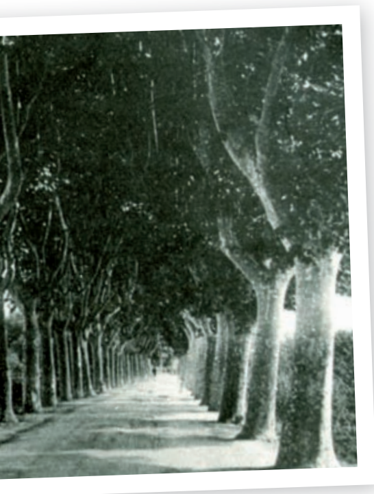
>> Antic passeig del Pont a Verges.