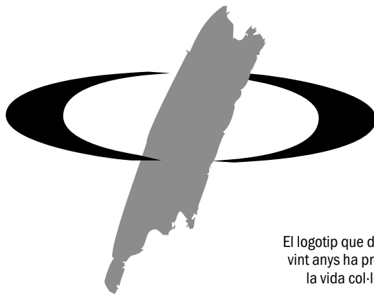
El logotip que durant vint anys ha presidit la vida col·legial.