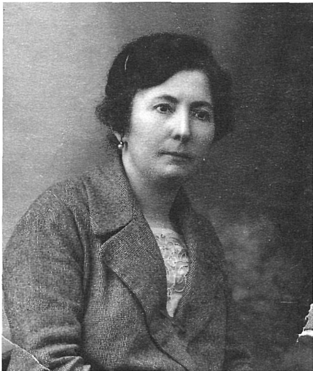
La maduresa de l'escriptora.

en vostra testa / mostrareu amb orgull al món enter; / com més gran, com més greu el sacrifici, / més lluirà la corona de llore».