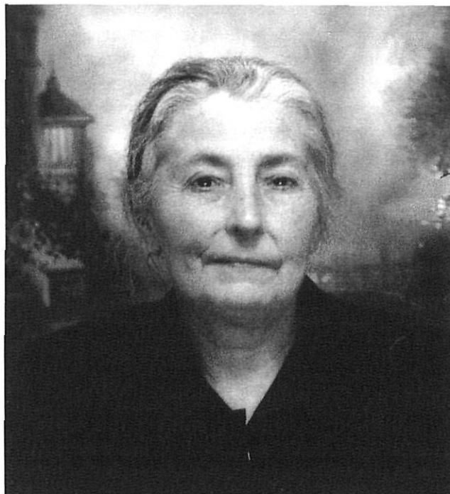
Els últims anys de Francisca Torrent.

L'escriptor va deixar inèdita molta obra en prosa i en vers. D'entre aquest copiosíssim material, destaquen els quaderns De ma vida (sentors bosquetanes) , De ma collita i A través del temps , i les Poesies adreçades a mos fills , Poesies adreçades a parents i amics , Poesies a la Verge , A la Ilum del Sagrari , Poemes religiosos , A redós del Congrés , Poesies humorístiques i Xarades , així com els quadres teatrals L'avi rondaller i L'oncle de casa , les proses Quadrets viscuts i innombrables fulls manuscrits amb poemes, oracions, versos i rodolins.