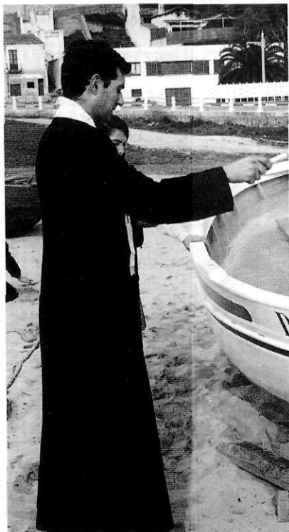
Vicari a Blanes, l'any 1966.