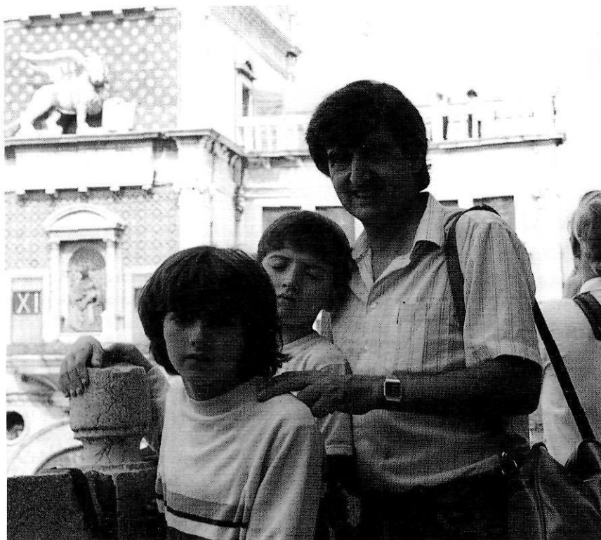
A Venècia amb els fills, l'any 1985.

No puc parlar dels seus aspectes docents perquè no vaig assistir a cap de les seves sessions de treball amb els educadors que es formaven en aquella escola, però sí de la regularitat de la seva presència a les reunions de l'equip directiu de l'escola (no recordo si en dèiem així, però sí que aquesta era la seva funció) a vegades prenent cafè a casa d'en Manel Palahí i d'altres al vespre a la Fundació, on es responsabilitzava de portar-nos la clau; també del to pausat i suau de les seves actituds i de les seves intervencions en les discussions, a vegades vehements i acalorades, que anaven marcant les decisions pedagògiques, i a vegades també polítiques, perquè no cal oblidar que aquella Escola d'Educadors va fer possible que els estudis d'educador esde-