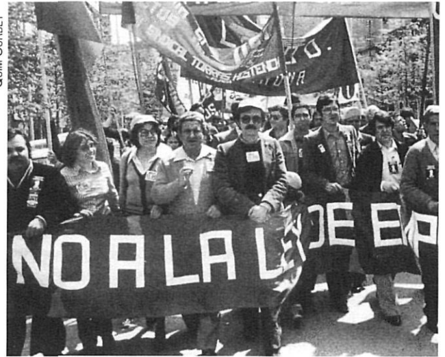
Una altra manifestació gironina.

intransigència del PSOE en matèria econòmica i social i va defensar el diàleg entre els agents socials com a element bàsic per a la democràcia.