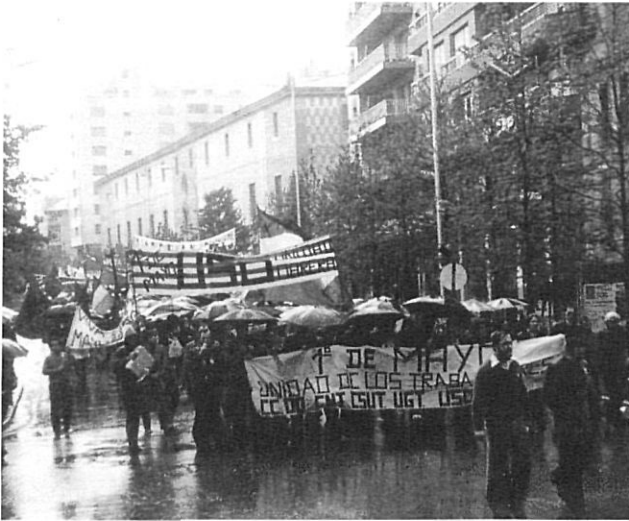
Manifestació del 1r de maig de 1978.