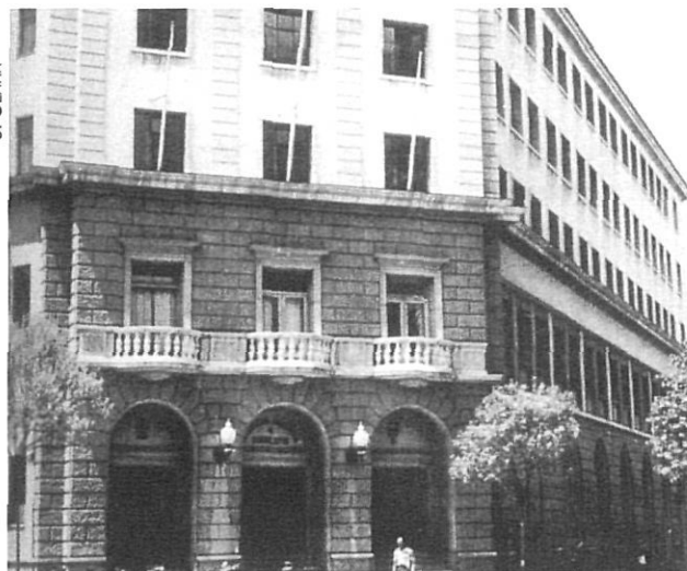
Edifici de la Delegació dels Sindicats Verticals.

quan, després de 20 anys de democràcia, els qui estan al poder no han tingut mai ni la voluntat ni la sensibilitat política d'obrir les portes de bat a bat als sindicats perquè tinguin el paper que tenen en els altres països europeus, els quals no han tingut la desgràcia d'haver de passar 40 anys de dictadura, prohibicions i persecucions.