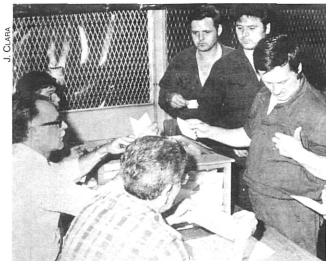
Votació en unes eleccions sindicals.