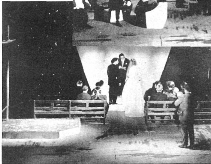
Dues escenes de « Nuestra Ciudad », de Thornton Wilder (Figueres, 1957).