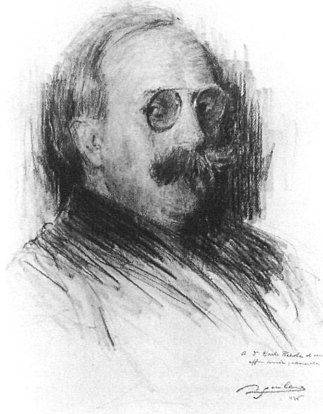
Retrat de Carles Rahola, 1926.

Tinc una confiança quasi absoluta en el meu art, enfortit encara més per el calvari sofert, horrible en alguns moments, i que sols ha sigut mitigat per l'actitud heroica (algun dia en parlarem) vertaderament sublim, de la meva aimada esposa, a qui puc dir dec en part lo que avui sóc.