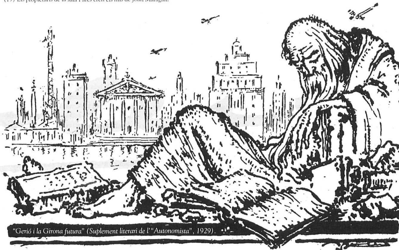
«Gerió i la Girona futura» (Suplement literari de l'«Autonomista», 1929).