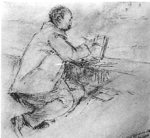
“Joaquim Mir pintant les cases de l’Onyar” ( Clarinet ”, 24-8-1930).