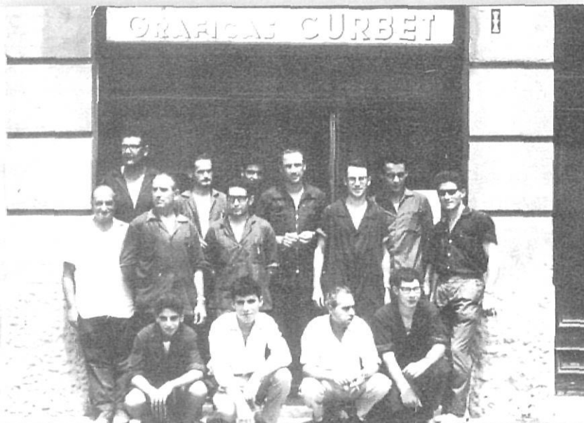
L'equip de Gràfiques Curbet que l'any 1965 va començar a imprimir PRESENCIA .