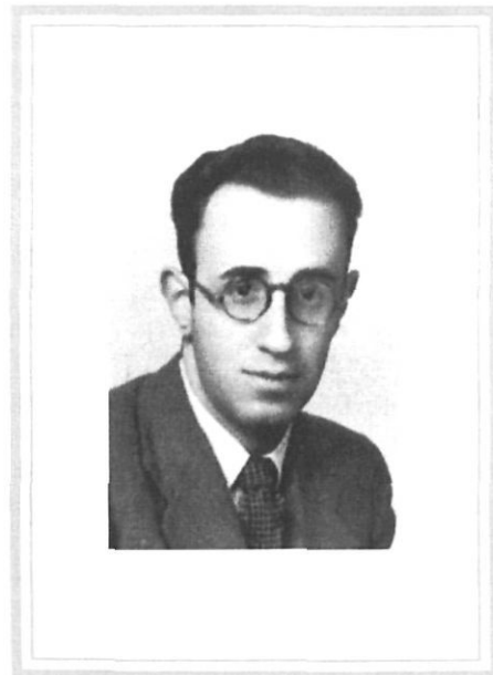
A dalt, Josep M. de Sagarra. A baix, Màrius Torres.

El cas és que Sagarra va estar enamorat de dues Mercès, i totes dues de les terres gironines. Uns anys més tard, un altre poeta, el lleidatà Màrius Torres (1910-1942), també es va sentir inspirat per una Mercè de Girona: Mercè Figueras. Va dedicar-li les reiterades Cançons a Mahalta (nom de la dama sepultada a la Catedral, muller del Cap d'Estopes) i en un dels poemes d'aquest títol s'al·ludeix expressament a «una ciutat pintada en gris i rosa / on un somni vençut, però immortal, reposa / sota nobles porxos antics». Mercè Figueras i Bassols, nascuda a Girona l'any 1908, va ser l'amistat més íntima del poeta, la dona que el malalt de Puig d'Olena va estimar amb un amor més pur, «blanc com un mes de Maria», segons la seva expressió. En una de les cartes, que fa poc s'han publicat, Torres pregunta a la seva amiga per «l'estimada Girona», en plena Guerra Civil: «És tan vetusta que goso creure que la revolució no l'haurà fet envellir gaire, i els majestuosos plecs de pedra del seu vestit deuen tenir encara la noblesa i la serenitat de les venerables faldilles de les dames d'antany».