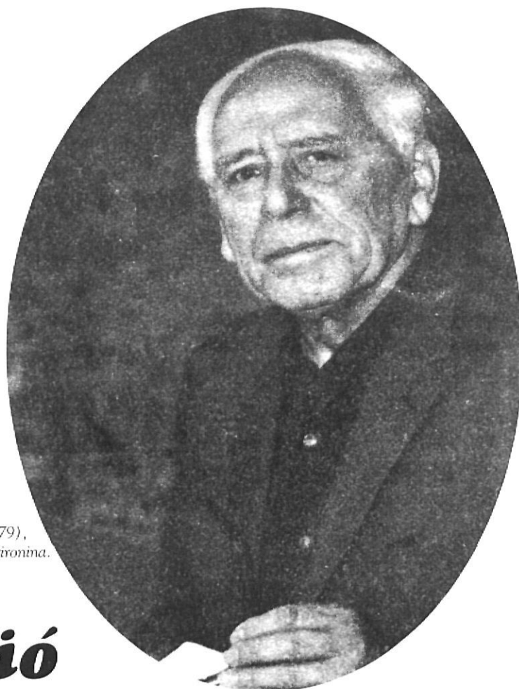
Damià Estela i Molinet (Besalú, 1904-Girona, 1979), figura cabdal de l'Església gironina.