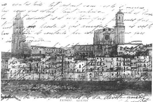
Qui no conserva a casa fotografies i postals antigues?