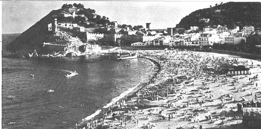
"Vista de lluny, Tossa és més bella", deia Miquel Vilà.