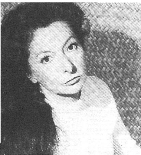
Remedios Varo, una agitada trajectòria sentimental i artística.

Per saber quelcom sobre aquesta gran desconeguda, el profà havia de recórrer fins ara a la Gran Enciclopèdia Catalana: “ Varo i Uranga, Remedios (Anglès, Selva, 1913 - Ciutat de Mèxic, 1963). Pintora. Filla de pare andalús i de mare basca. Es formà a l'escola de San Fernando de Madrid. Durant la guerra civil residí i tingué taller a Barcelona. Separada del seu primer marit, el dibuixant i cartellista Gerard Lizarraga, es casà amb el poeta surrealista Benjamin Péret, amb qui visqué a París (1938-42) i a Mèxic, fins a la separació de Péret, que retornà a París el 1947. Visqué un quant temps a Veneçuela, on es guanyà la vida fent il·lustracions. De nou a Mèxic, es tornà a casar i aviat es consagrà com una de les figures cabdals del surrealisme en aquell país. (...) Quasi tota la seva obra és a col·leccions particulars i museus americans”.