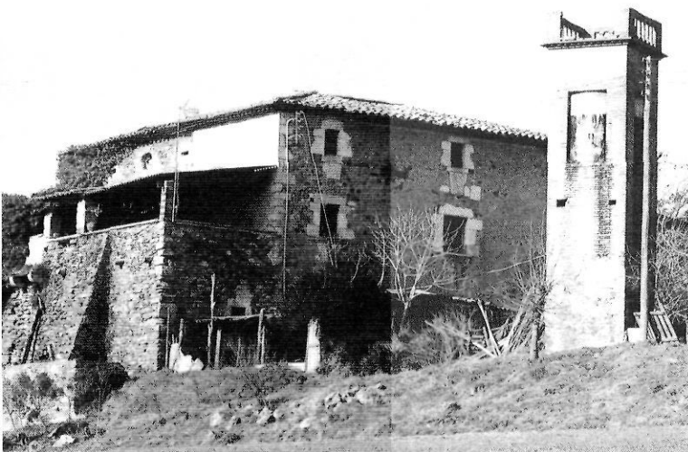
"Paratge on tot és clar, transparent, gràcil i feliç..."

A l'altra part de la població, una vall verda, humida, clara. Un convent, de mitrada abadessa, s'hi destria. Un pont minúscul uneix les dues vessants. Els camins serpegen entre faldees de corbes dolces. I al límit de la ciutat, les muralles posen un gest bel·licós i una recordança de passades existències.