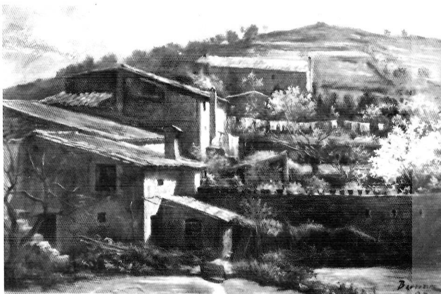
Cases de Sant Daniel en un oli de Prudenci Bertrana.