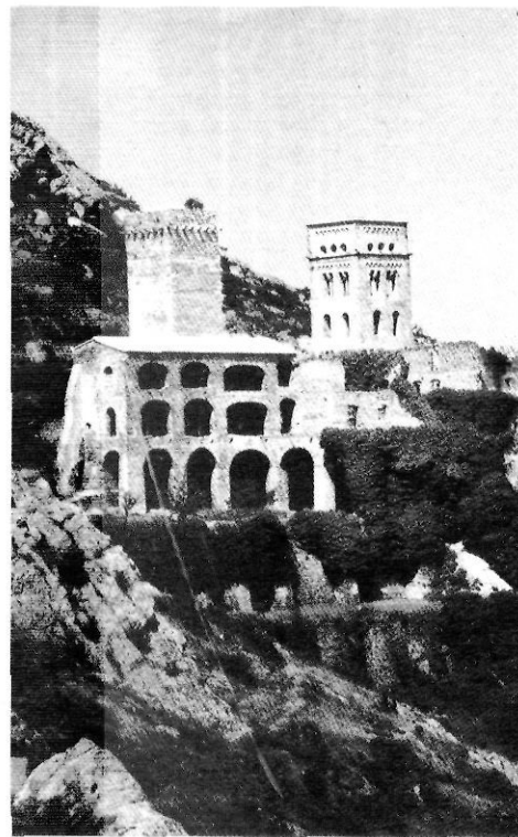
El monestir de Sant Pere de Roda torna a ser actualitat.

Però no han de ser els ocells els habitants de l’abadia, sinó els homes i les dones que no som hereus del duc de Medinaceli, sinó d’aquells que el van alçar a imatge i semblança d’un país que també es començava a construir. Per això Pla podia dir que, si perdiem Sant Pere de Rodes, el país s’enfonsava encara més que les mateixes parets del monestir.