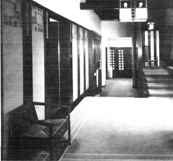
El rebedor de la Hill House, de Charles R. Mackintosh.