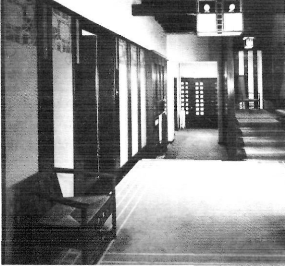
El rebedor de la Hill House, de Charles R. Mackintosh.