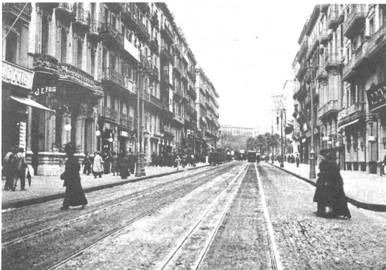
El carrer Pelai de Barcelona a començament de segle, amb l'edifici de "La Vanguardia" a primer terme, a l'esquerra.