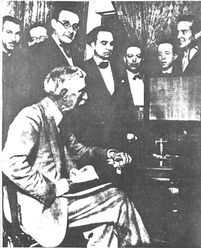
Exemplar de "La Vanguardia" del 18 d'agost de 1931.

EL PRESIDENTE DE LA GENERALIDAD EN MADRID